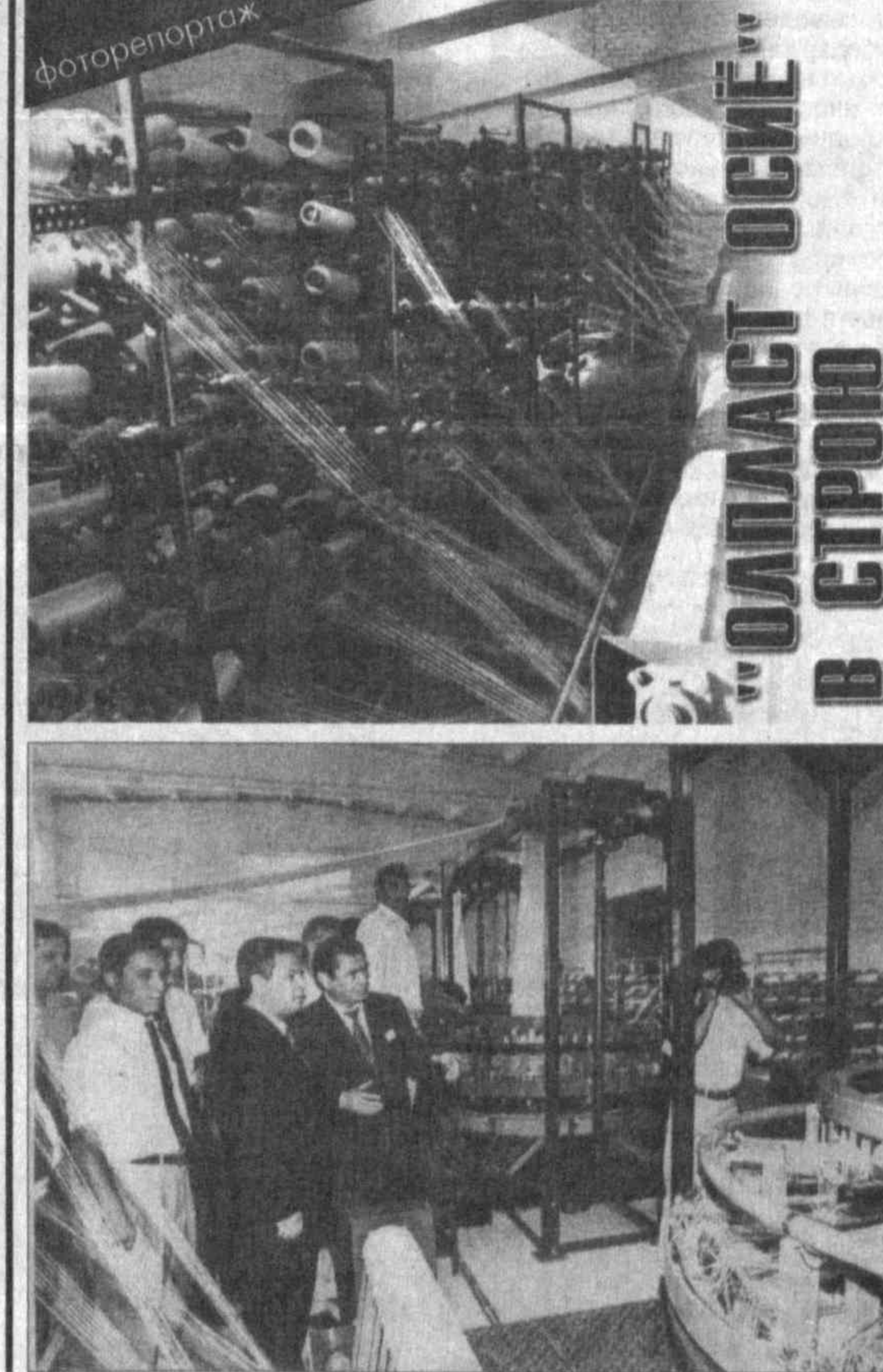
НА СНИМКЕ: во время открытия частного производственного предприятия.

Организация, готовящаяся в предстоящем году к празднованию своего 50-летия, стремится укрепить свои позиции на политической арене. Европейский Союз и процветания.