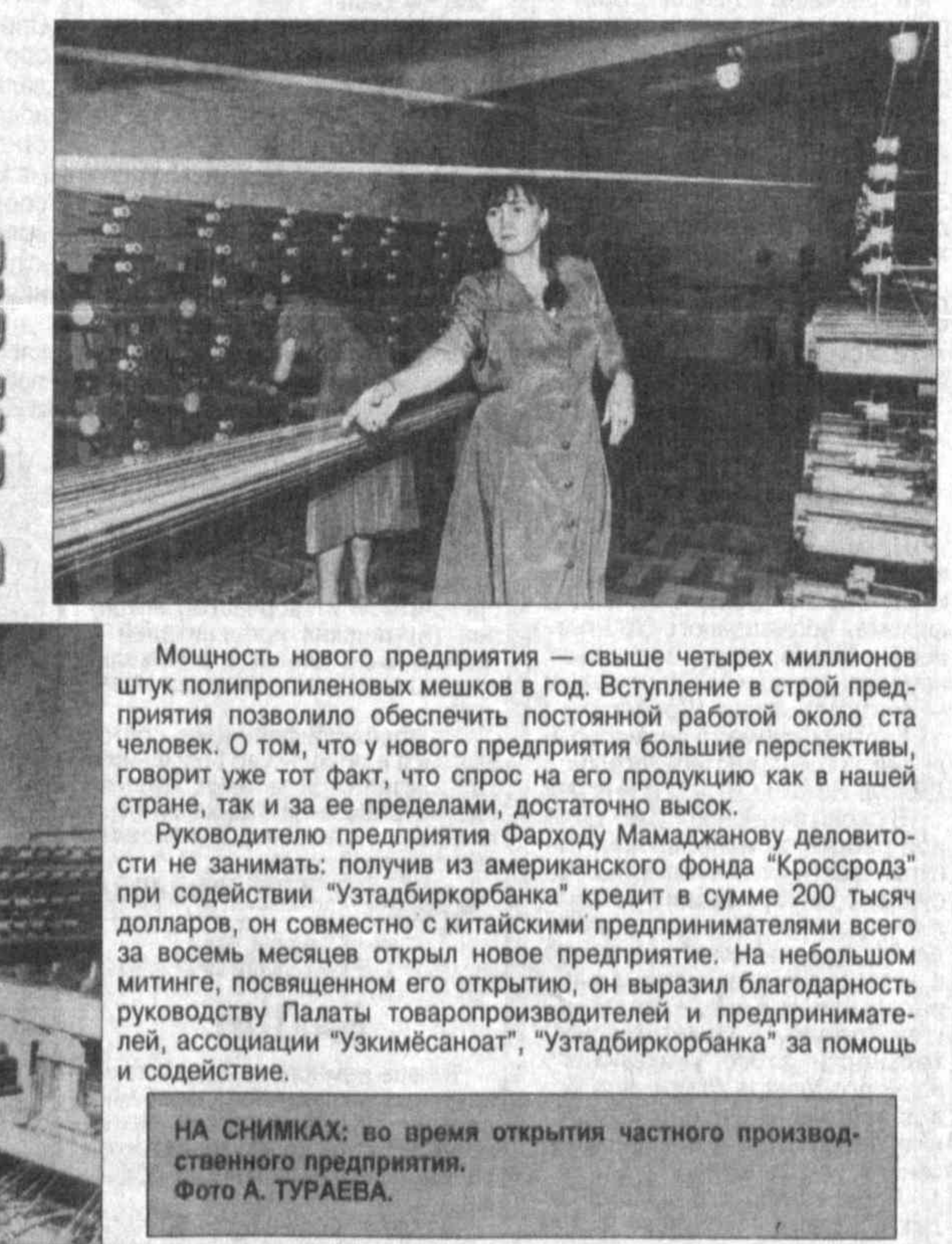
НА СНИМКЕ: во время открытия частного производственного предприятия.