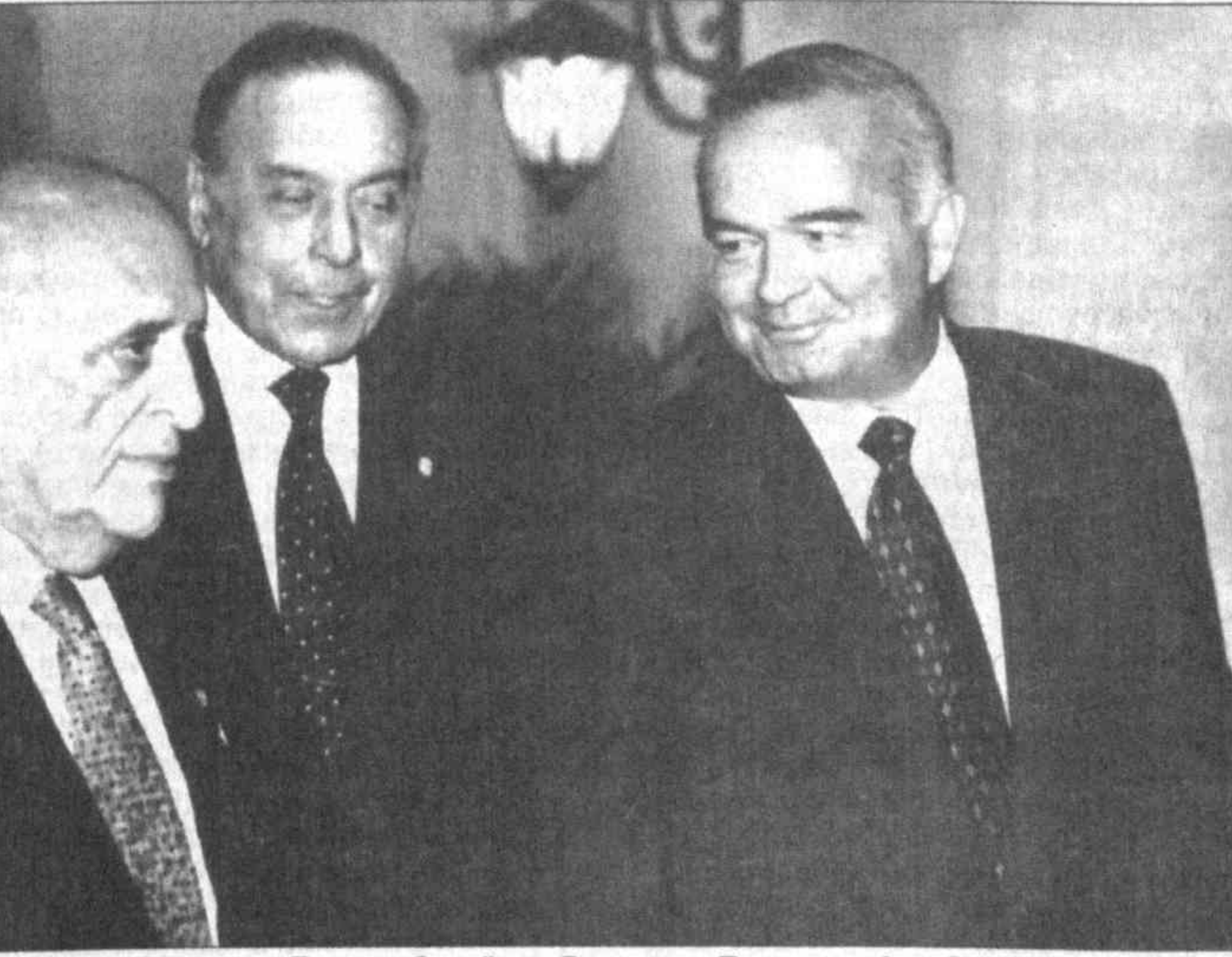
Во время встречи — Президент Турции Сулейман Демирель, Президент Азербайджана Гейдар Алиев, Президент Узбекистана Ислам Каримов.

Говоря о Бакинской конференции, нужно особо отметить: к работам, осуществляемым в рамках ТРАСЕКА, с интересом относятся не только страны — ее участники, но и другие государства мира. Об этом свидетельствует тот факт, что в конференции приняли участие 32 страны мира, а также представители более десяти авторитетных международных организаций, таких, как Организация Объединенных Наций, Европейский банк реконструкции и развития, Всемирный банк. Важным шагом на пути реализации грандиозного проекта стала створка в 1996 году в местечке Серхас железнодорожных магистралей Центральной Азии и Ирана. Тогда же, 13 мая 1996 года, в Серхасе был подписан Договор о предоставлении друг другу режима свободного транзита между Узбекистаном, Азербайджаном, Грузией, Туркменистаном, У республик, которые начали пользоваться этой важной частью древнего караванного пути, проложенного от Японии до Адриатического моря, значительно снизились затраты, и они даже стали получать доход. Естественно, что может возникнуть вопрос: какую же пользу принесло это Узбекистану? Узбекистан от реализации договора сэкономил на перевозке около 12 миллионов долларов. Ведь ТРАСЕКА по сравнению с северным направлением ко-