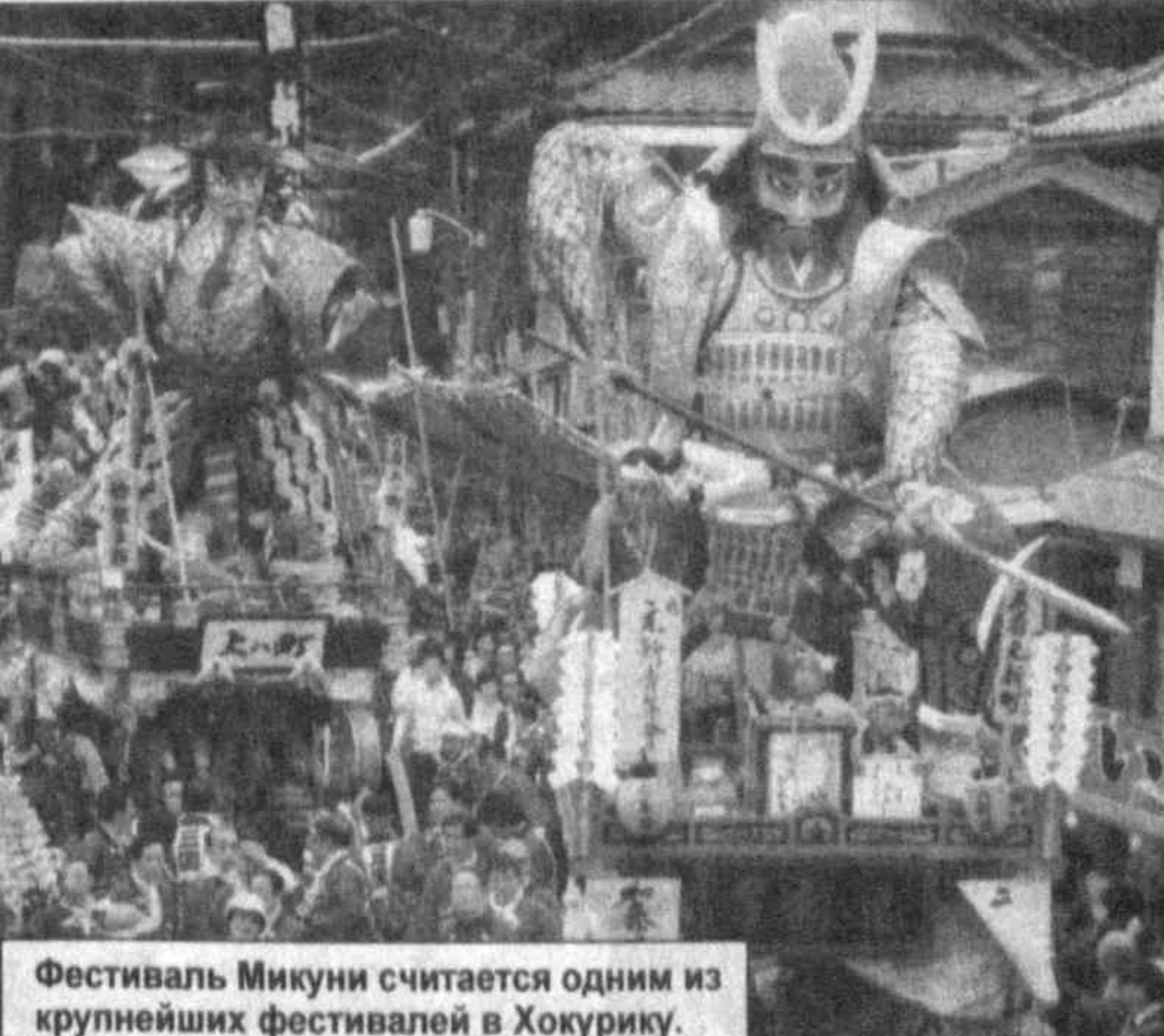
Фестиваль Микуни считается одним из крупнейших фестивалей в Хокурику.

хотную мишень из водородного топлива и разогреют ее до сверхвысокой температуры. Термоядерная реакция должна завершиться миниатюрным взрывом, хотя и в лабораторных условиях. Тем не менее авторы доклада убеждены, что это станет первым нарушением Договора о всеобъемлющем запрещении ядерных испытаний, который подписали 150 стран, включая США и Францию.