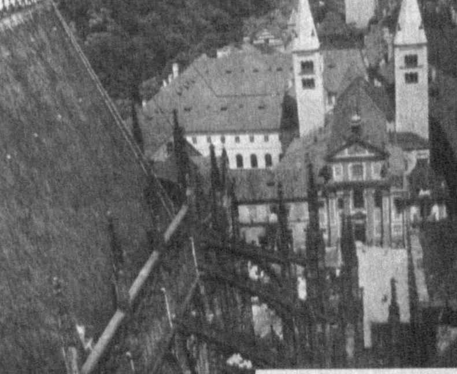
Прага. Базилика Св. Георгия.