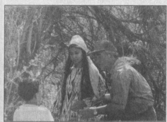
атмосферы, пейзажей и достоверность, емкость, сочность актерской игры.

по жанру сказка, где допустимы прямолинейные характеристики: плохой — хороший, добрый — злой, жадный — щедрый и т.д.