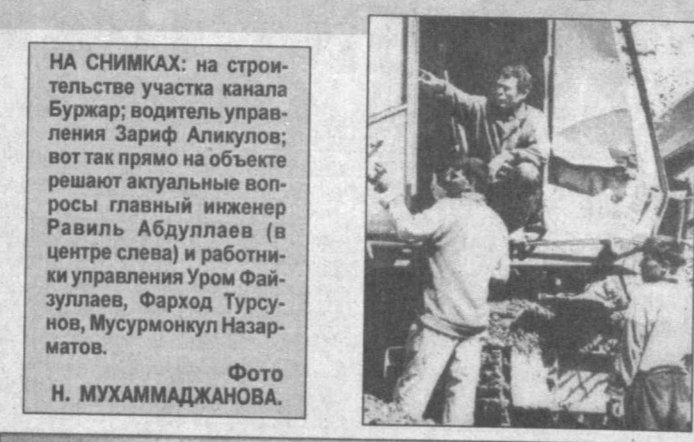
НА СНИМКАХ: на строительстве участка канала Буржар...