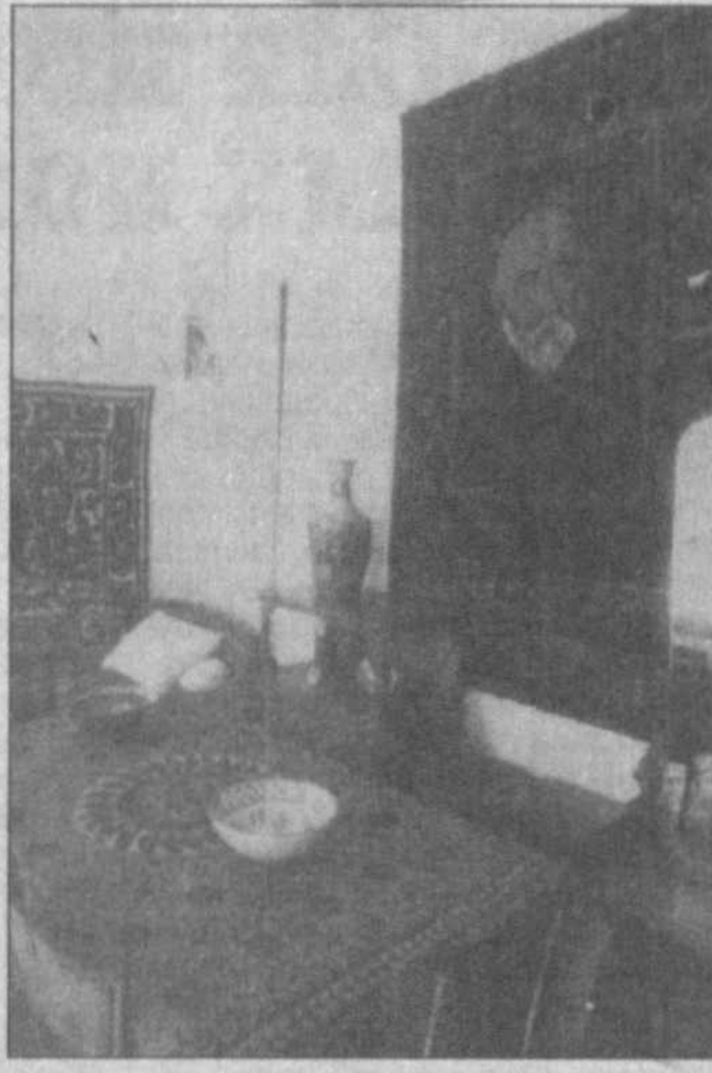
НА СНИМКАХ: в музее Саидриддина Айни. (У.А.)