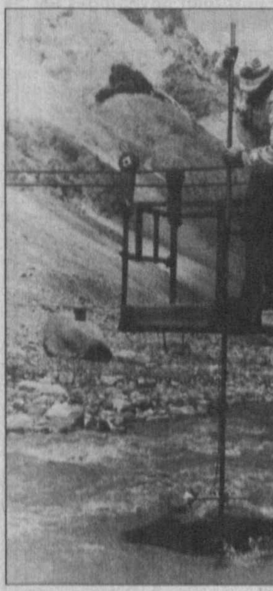
НА СНИМКАХ: с гидрологической лыжи снимаются характеристики водного потока; определение скорости водного потока под прорывоопасной плотинной горного озера.

Главный геолог Государственной службы Республики Узбекистан по слежению за опасными геологическими процессами В. КИМ: