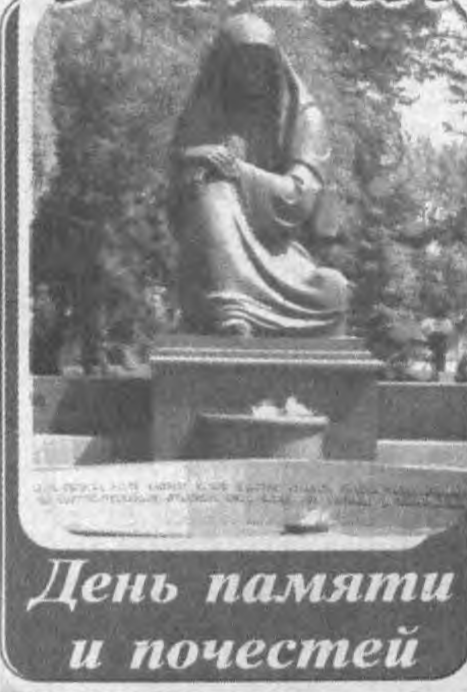
День памяти и почестей