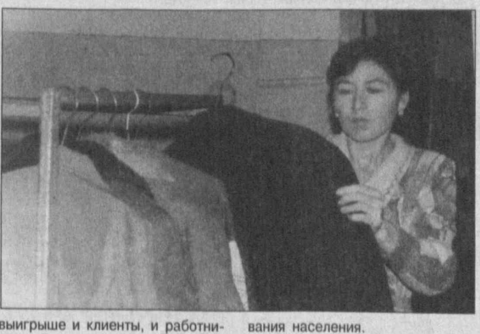
выигрыше и клиенты, и работники этой точки бытового обслуживания населения.

У вас испачкалась любимая одежда? На ней появилось масляное пятно или остатки нечаянно пролитого соуса? Или... Да мало ли чем можно испортить по неосторожности ее внешний вид! Опытные хозяйки знают, как действовать в таких случаях, но даже они подчас бессильны идеально сделать то, чего хотелось бы. А если за дело возьмется дилетант, не сомневающийся в своих способностях, то недолго и до плачевного результата — так нарядившаяся блузка или пиджак станут втуне и к лицу лишь огородному пугалу.