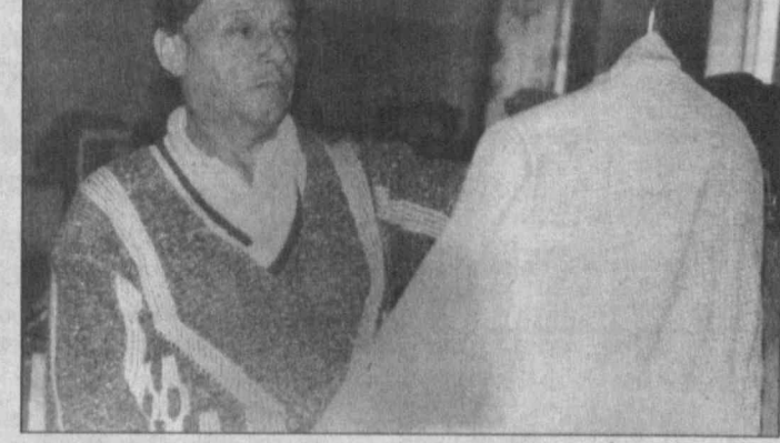
Сфера бытового обслуживания

У вас испачкалась любимая одежда? На ней появилось масляное пятно или остатки нечаянно пролитого соуса? Или... Да мало ли чем можно испортить по неосторожности ее внешний вид! Опытные хозяйки знают, как действовать в таких случаях, но даже они подчас бессильны идеально сделать то, чего хотелось бы. А если за дело возьмется дилетант, не сомневающийся в своих способностях, то недолго и до плачевного результата — так нарядившаяся блузка или пиджак станут втуне и к лицу лишь огородному пугалу.