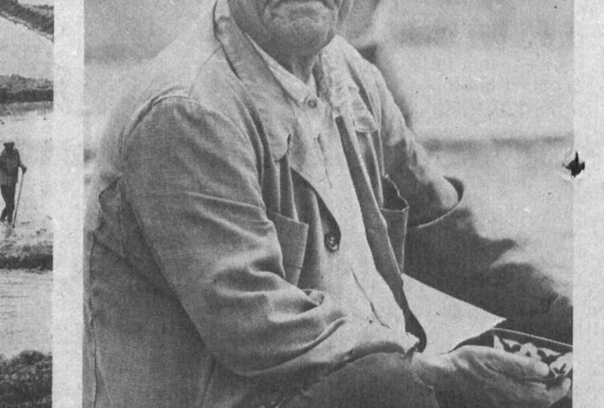
УзССР. Рисоводство в хозяйстве занимается семейные коллективы на подвоях...