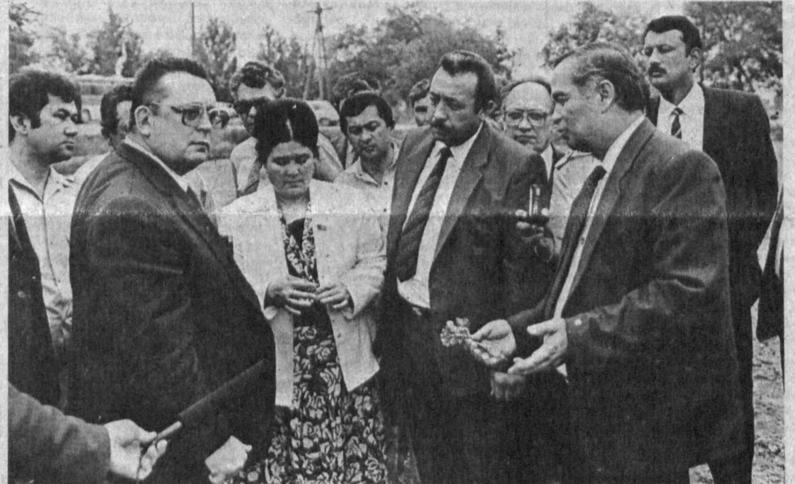
УЗБЕКСКАЯ ССР. В республику прибыл премьер-министр СССР В. С. Павлов. Поездка связана с актуальными задачами сегодняшнего дня, в частности, с решением проблем перехода на рыночные отношения.

В нынешнем году коллектив объединения совместно с минскими моторостроителями намерен выпустить и опытный трактор с 20-ступенчатым двигателем. Эту машину давно ждут на селе. И все же, как было подчеркнуто на встрече, без помощи союзного правительства, без четкой, взыскательной программы выхода из кризиса не обойтись.