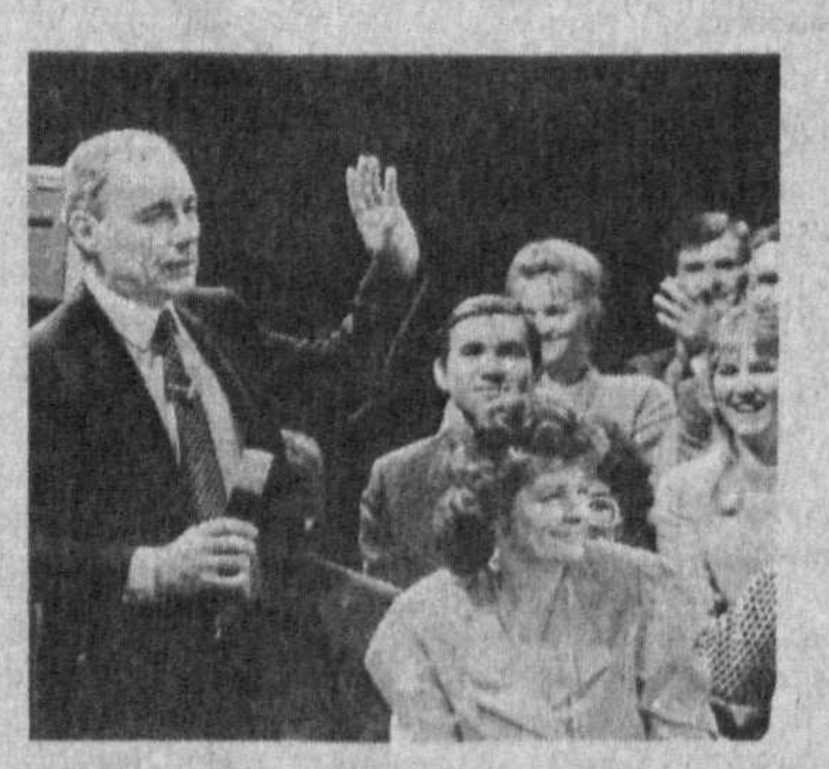
Владимир Познер в передаче «Вопросительный знак» — 30 мая в 17.35.