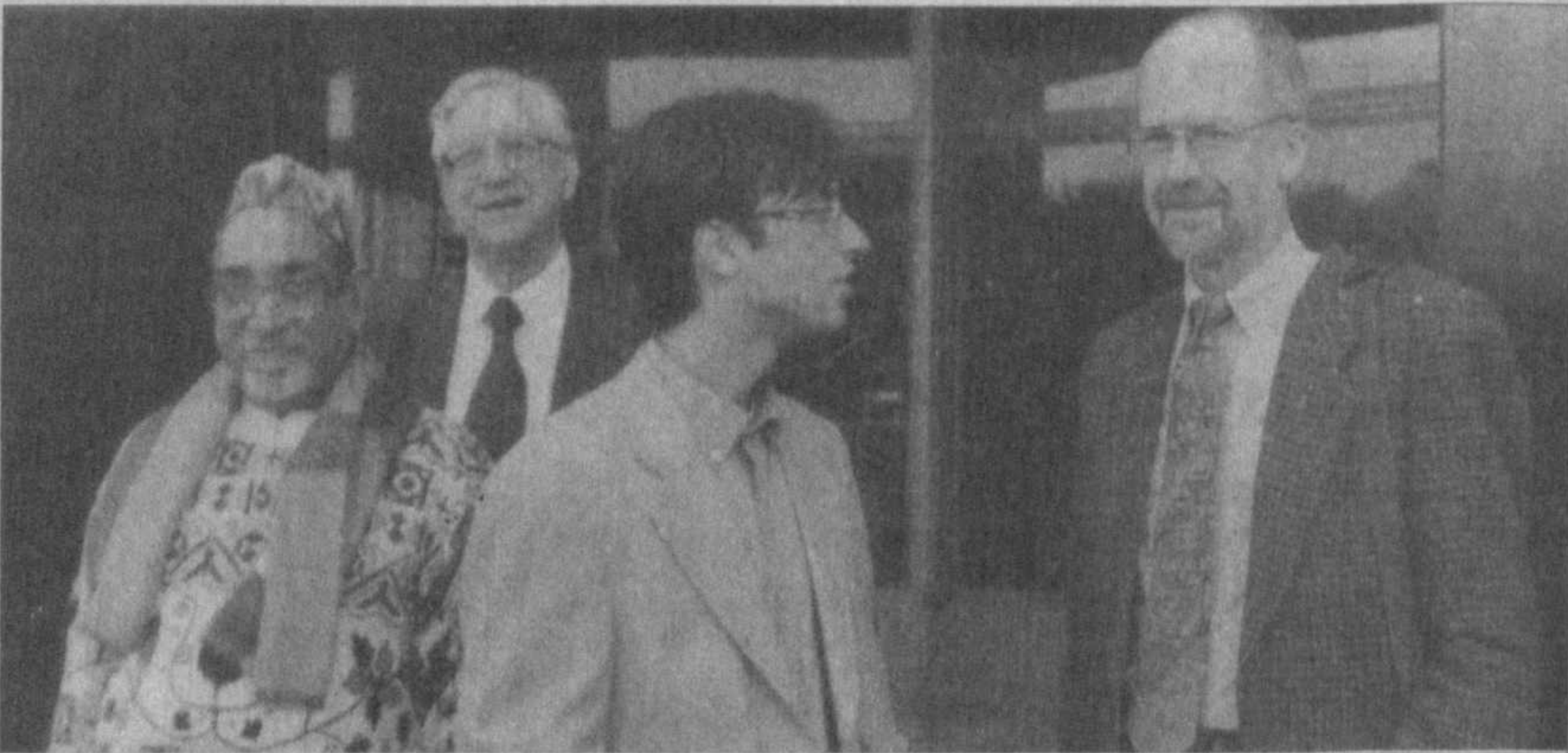
НА СНИМКЕ: группа зарубежных гостей из Индии и Германии.

Я приезжаю в Узбекистане на юбилей ученого, а также узнать новое о поиске узбекских ученых в области астрономии. В вашем Институте востоковедения, имеющем взаимосвязи с Индией, находится рукописи, с которыми мне хотелось бы ознакомиться. Я приезжаю в Узбекистане четвертый раз, впервые был здесь в 1985 году, затем на юбилей Улугбека в 1994 г. и на торжествах, посвященных Амиру Темуру, в 1997 г.