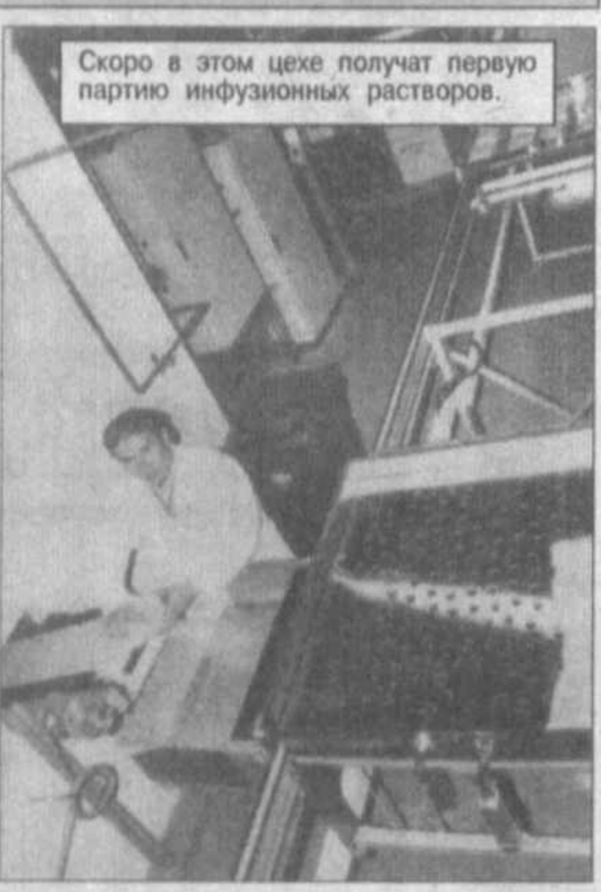
Скоро в этом цехе получат первую партию инфузионных растворов.

Следует отметить: "Технофарм" за четыре года своего существования смог выдержать испытания на прочность и занять свое место среди АО, родственных по профилю работы. Общество занимается оптовой закупкой импортных лекарственных средств, субстанций, медицинской техники. Оно также совместно с Государственно-акционерным концерном "Узфармпром", УзФПТИ, Международной финансовой корпорацией Всемирного банка, индийской фирмой "Кор