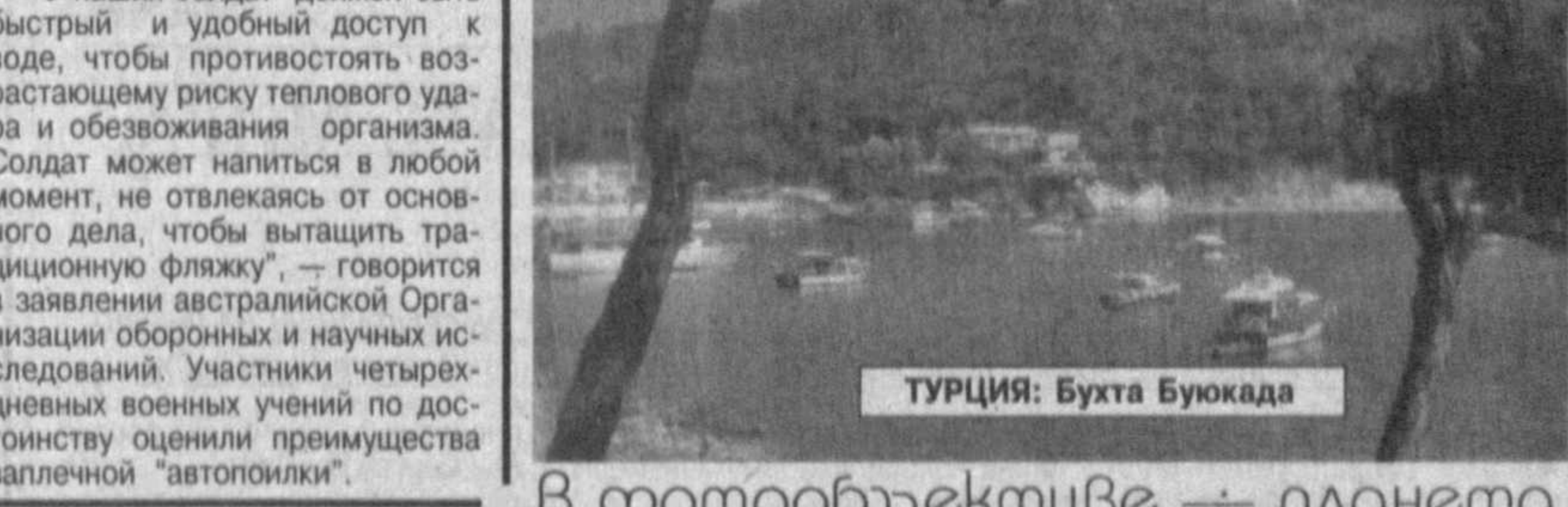
ТУРЦИЯ: Бухта Букоада

"Думлупынар" — могила героев" — такое название получил фильм, к съемкам которого вскоре приступят турецкие кинематографисты. Он повествует о гибели в 1953 году подводной лодки ВМС Турции в ходе учений НАТО и, по заявлению авторов картины, будет не хуже популярного "Титаника". Сценарист фильма Эркин Озверен так говорит о своем проекте: "81 героя, нашего последнего пристанища на морских глубинах, в течение 35 лет помнили лишь 4 апреля, в очеред-