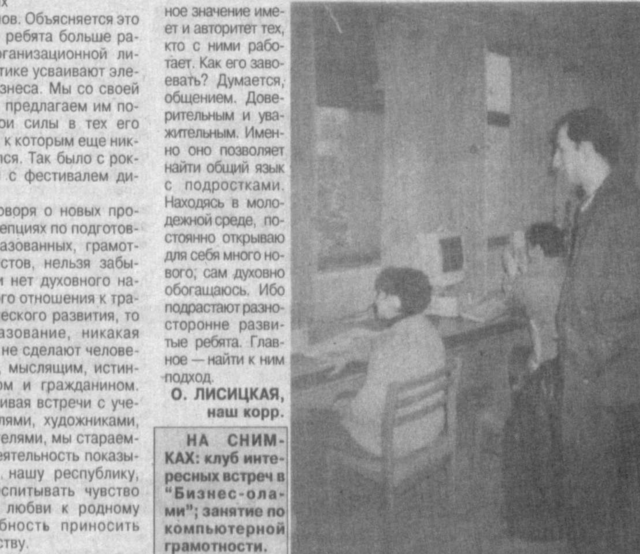
НА СНИМКАХ: клуб интeрeсных встреч в "Бизнес-олами"; занятие по компьютерной грамотности.