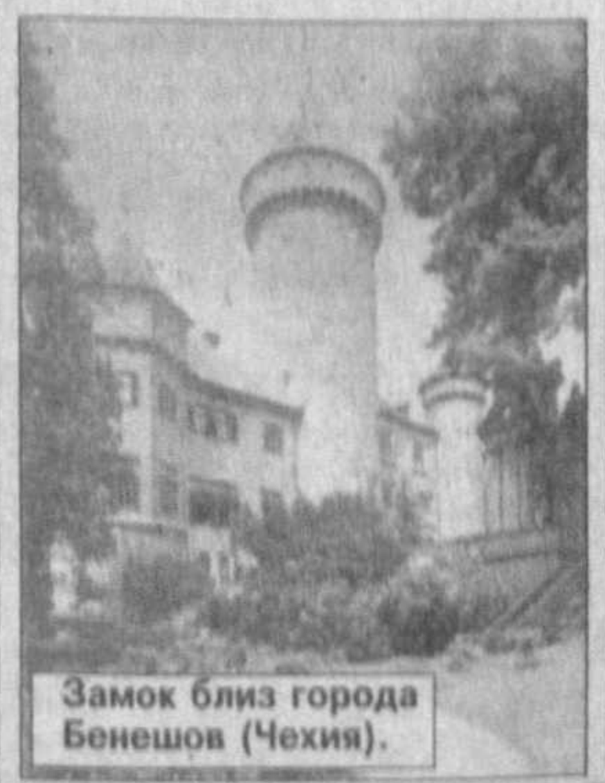
В фотообъективе — города мира