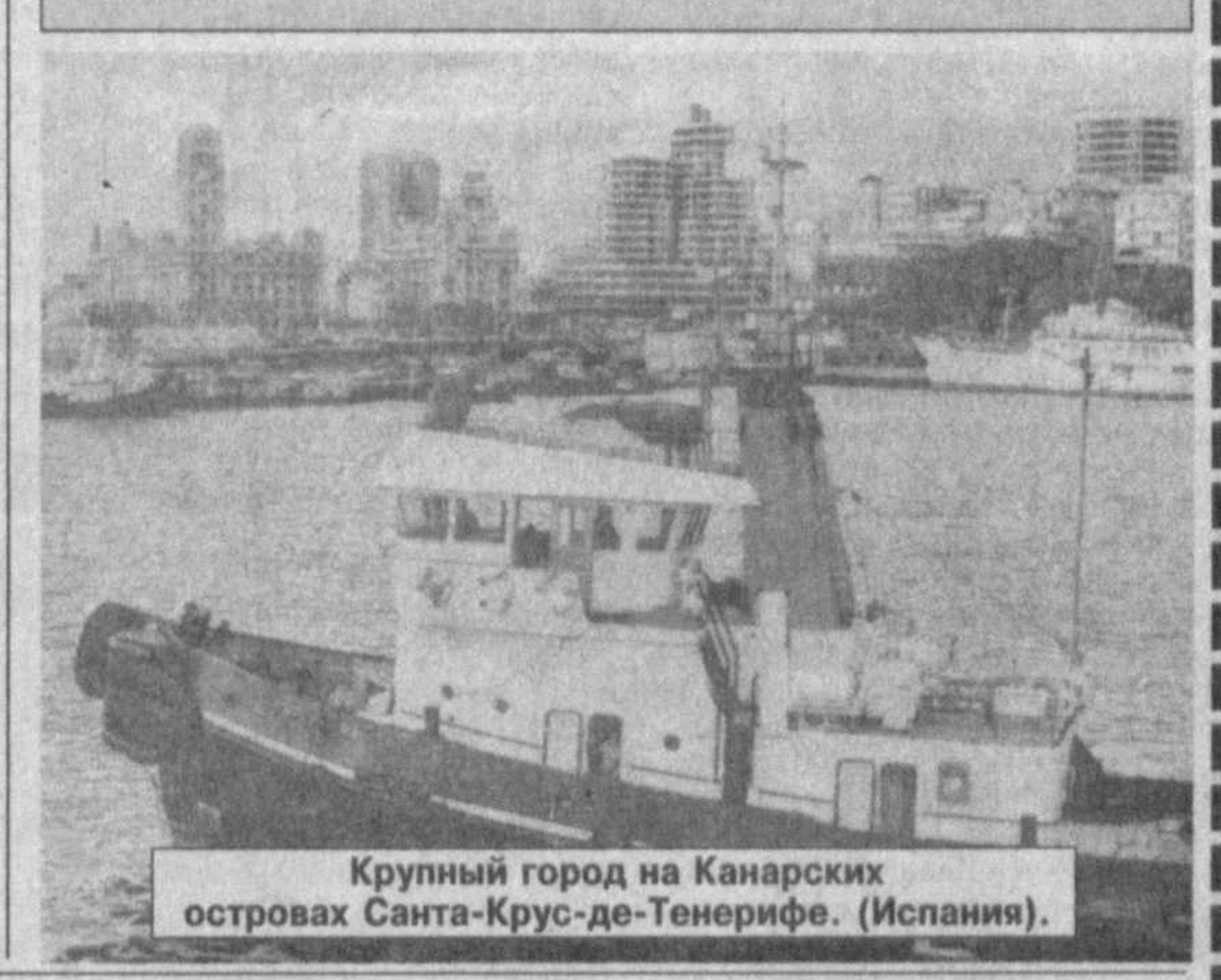
Крупный город на Канарских островах Санта-Крус-де-Тенерифе. (Испания).