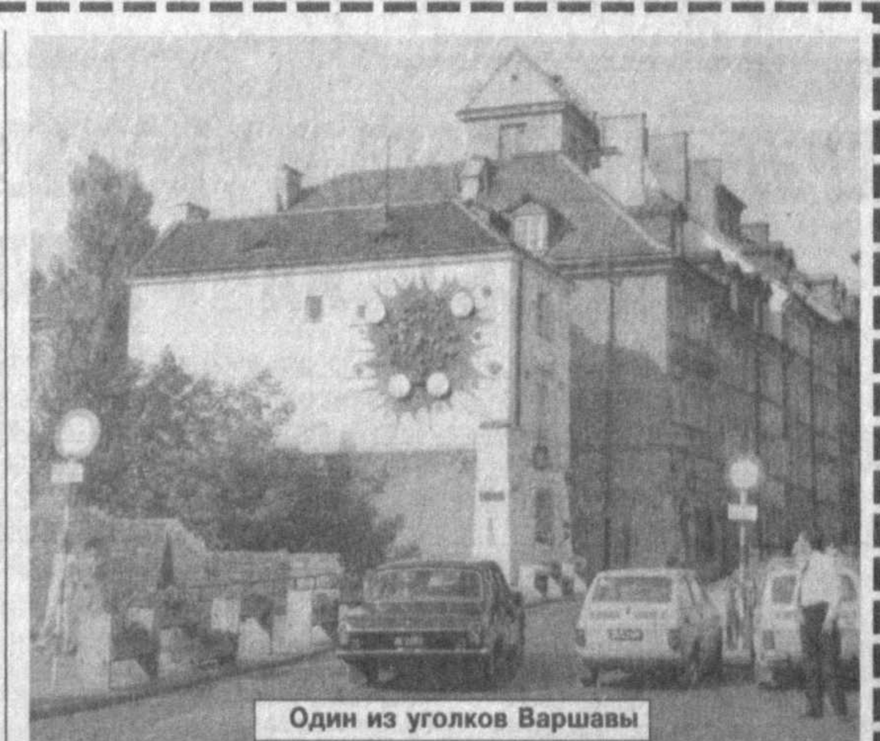
Один из уголков Варшавы

Этот подземный коридор и ранее использовался французскими, швейцарскими и другими зарубежными физиками для экспериментов по изучению элементарных частиц. Здесь сейчас находится крупный экспериментальный ускоритель, так называемый большой электронно-позитронный коллайдер, который используется находящимся в Женеве Европейским центром физики элементарных частиц (ЦЕРН).