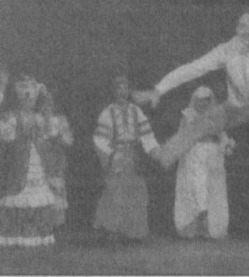
НА СНИМКАХ: сцена из спектакля "Любовный вертеж"