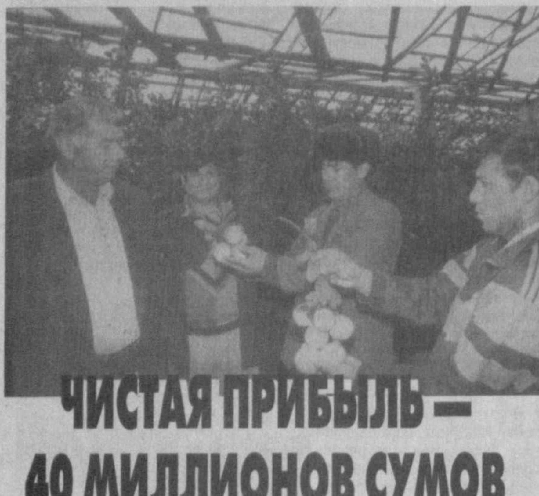
Чистая прибыль — 40 миллионов сумов

Не за горами Новый год. И каждое из предприятий, малое или крупное, подводит итоги, строит планы на будущее. У земледельцев коллективного хозяйства "Халкабад" Термезского района перспективы весьма обнадеживающие. На счету сельхозпредприятия — 40 миллионов сумов. Сказалась полученная свобода действий и предприимчивость. Экономнее и бережнее используется земля, вода, техника,