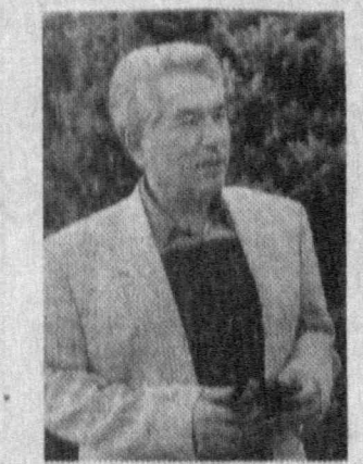
Чингиз Айтматов билан учрашди, унинг дил

Қардош туркий халқларининг ўзаро алоқалари мустақиллик йилларида мазмунида чўнг бир улутларнинг қасб этдики, бунга Президентимиз талонидан илҳами сурилади. «Туркистон -- умумий уйимиз» ширини янги куч ва илҳом бағиш этди. Айниқса, қон-қардош халқлар эътибори, ёвузи ва ширинлари, олим савияткорлари ўртасидаги салбий дўстлик, биродарлик ривожлари янада мустаҳкамланди. Мухбиримиз мамлакатимизга таъриф буюрсан қирғиз халқининг жаҳонга машҳур хисос адаби Чингиз Айтматов билан учрашиб, унинг дил