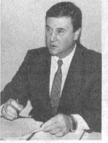
Уларни қизиқтирган саволларига жавоб олишлари мумкин. Ўқувчиларнинг саволлари ва вазир ўринбосарининг жавоблари ҳар икки газетада чоп этилади.