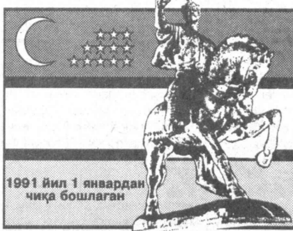
1991 йил 1 январдан чиқа бошлаган