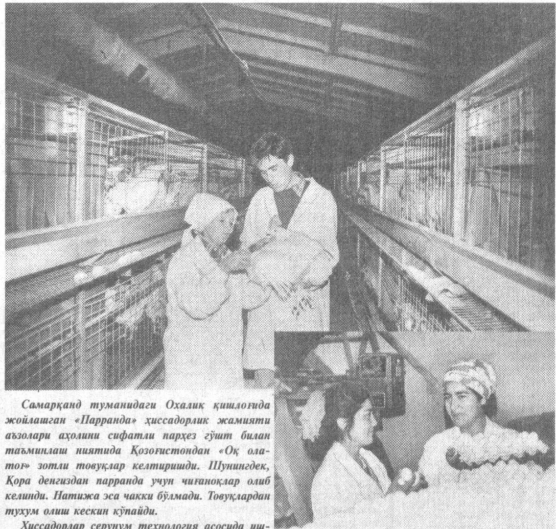
Самарқанд туманидаги Охалик қишлоғида жойлашган «Парранда» ҳиссадорлик жамияти аъзолари аҳолини сифатли парҳез гўшт билан таъминлаш ниятида Қозғистондан «Оқ олат» зоти товуқлар келтиришди...