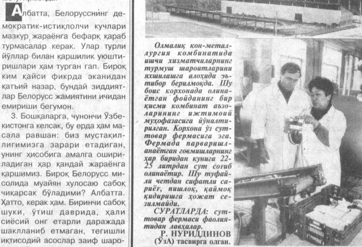
Олмалик кон-металлургия комбинатида ишчи хизматчиларнинг турмуш шароитларини яхшилашга алоҳида эътибор берилмоқда. Шу боис корхонада олинаётган фойдаланган бар қисми комбинат аъзоларининг ижтимоий муҳофазасига йўналтирилган. Корхона ўз суттовар фермасига эга. Фермада парвартишланаётган говмишларнинг ҳар биридан кунига 22-25 литрдан сут соғиб олинаётир. Шу тўғрисида маълумот қаймоқ қидиришга ҳоҳат сезилмайди.

Россия билан бирлашув иқтисодий жиҳатдан ҳам нафис эканлигини юқорида айтдик. Энг юксак даражадаги технологиялар эса Фарбда. Оммавий ахборот воситалари (ОАВ) берган хабарга кўра эса Европа Иттифоқи шу кунларда Белоруссга бир неча йил бурун берилган ўз ташкилотидagi кузатувчилик макомидан маҳрум қилган, бу мамлакатдаги инсон ҳуқуқлари бузилаётганидан безовталанган, яқин-