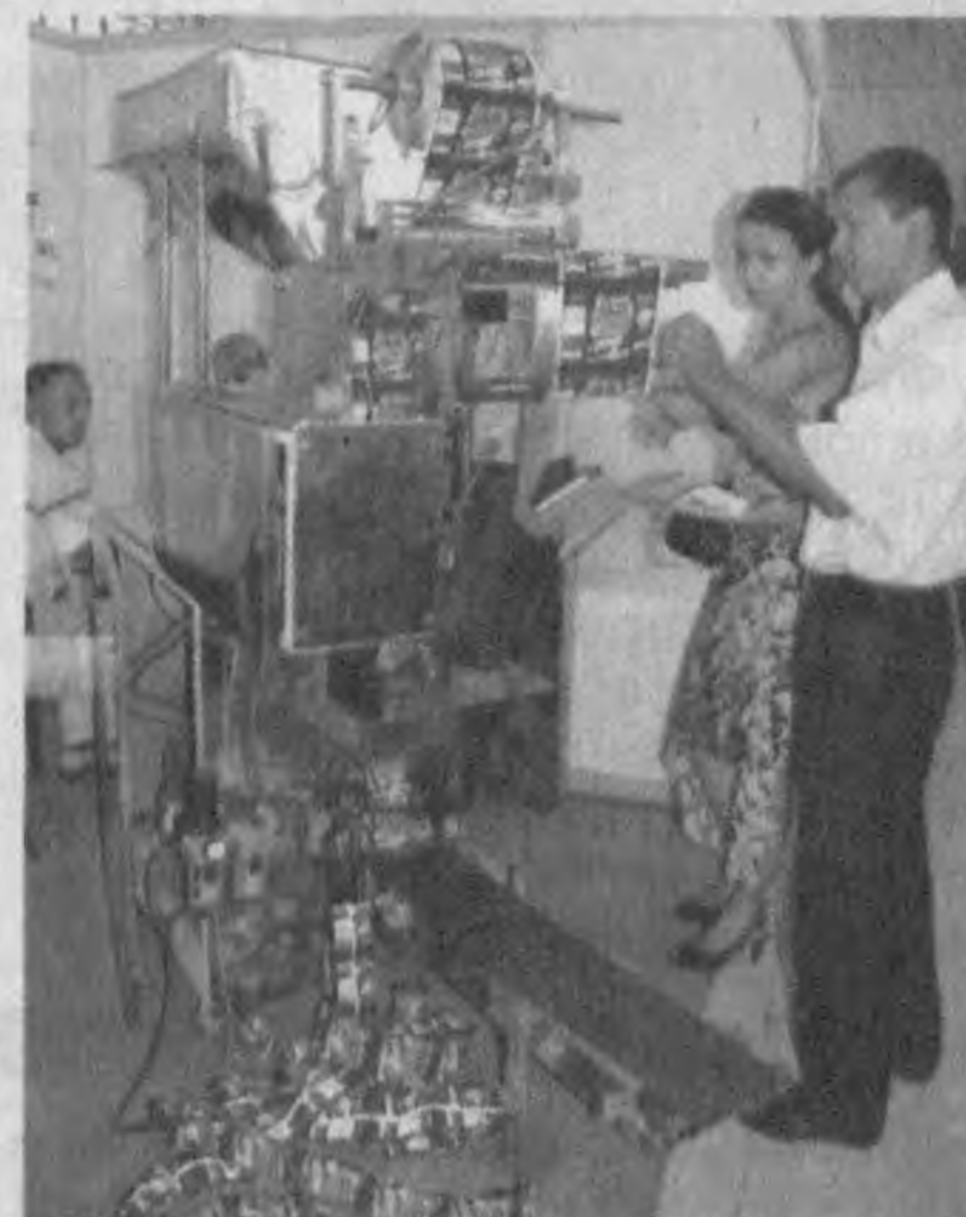
Сergeй АЛЕКСЕЕВ, наш корр.

По мнению многих посетителей «India Minitech-2008», выставка представляет большой интерес и в плане знакомства с новыми мини-технологиями и ком-