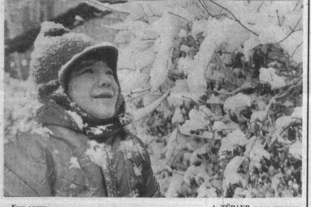
Қиш зерки...

ва фавқуллода ҳолис содир бўлганда қандай ҳаракат қилишни билинмайдиган. Бахтсиз ҳолисларни руй бермаслиги мақсадли яна бир бор эслатимиз: -- табиий газда ишлатиладиган газ асбоблари ва иситиш мосламаларини лоямий равишда назорат қилиб туриш; -- болаларни ёлғиз уйда қолдириш, айниқса, газ асбоблари ишлаб турган пайтда; -- агар уйда газ иситиш сезилсиз, теда газ хисмати ва ёнидан сақлан хисматига хабар бериш; -- оила аъзоларини тапшиқрига чиқариб, хованин шамоллатиш; -- учун чиқарувчи электр мосламаларини ёқманг. Эсда тутиш! Газ асбобларидан фойдаланишда қуйидагилар таъқиқланади: -- газ плиталари ва газ қувурларини ўзбошимчилик билан таъмирлаш; -- газ плиталари ва иситиш мосламаларини буррамаларини ёдларини манбаъисиз (туғурт, эл. ёдларини мослама) очин; -- газ ускуналарни ва иситиш асбобларини ишлатишни болаларга топшириш; -- газ плиталари ва иситиш мосламалари устиди кийимларни қургитиш учун илб қўйиш. Ўзбекистон Республикаси Ички ишлар вазирилик Енгиндан сақлаш бошқармаси.