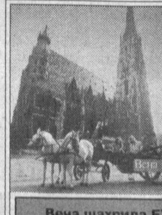
Вена шаҳрида ЕХХТ Парламент Ассамблеяси билан Австрия Миллат мажлиси ҳамкорлигида ташкил қилинган парламентаризм ва демократия масалаларига бағишланган халқаро семинарда мамлакатимиз парламенти вакиллари ҳам иштирок этди

Австрия кейинги қирқ йил ичида иқтисодий жиҳатдан мисли қўрилмаган натижаларни қўлга киритди. Автомобилсозлик, электро-