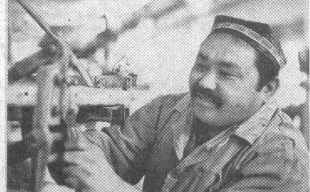
Бағдод тумани таъмирлаш-ишлаб чиқариш ҳиссодорлик жамияти аъзолари баҳорги эски мавсумига техника воситаларини тайёрлаб бериш борасида бир талай муваффақиятларга эришмоқдалар. Жумладан, ҳиссодорлик жамиятига бу йил пуштага чиқит экандаи селкалар учун қўлаб буюртмалар тушди.

Баҳс-мунозараларда мамлакатимиз парламент вакиллари ҳам фаол иштирок этди. Ўзбекистонда, айни пайтда, сиёсий партияларнинг эркин фаолият юритиши учун барча ҳуқуқий мезонлар яратилган, дейди Олий Мажлис депутати, Олий Мажлис Котибияти бошлиғи Омон Олимжонов. Парламентимиз бундан рол-поса йитирига кунча олдин барча сиёсий қатламларнинг