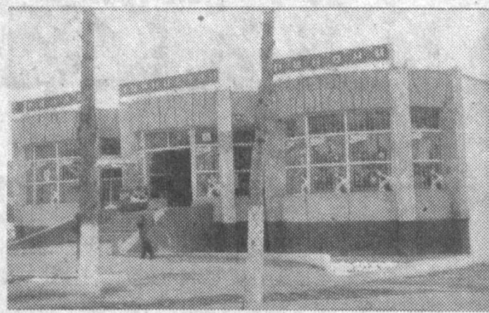
Давлатотбанд туманида тадбиркор ва ишбилармонларга кенг йўл очиб, уларга зарур шарт-шароитлар яратилганлиги боис аҳоли хизмат курсатиш тури ва сўрали аҳолининг, тўқтин маркази ва қишлоқлари тобора широй очмоқда.

Ахборот олиш ҳуқуқининг бузилишида айбдор бўлган шахслар қонун ҳужжатларида мувофиқ жавобгарликка тортиладилар.