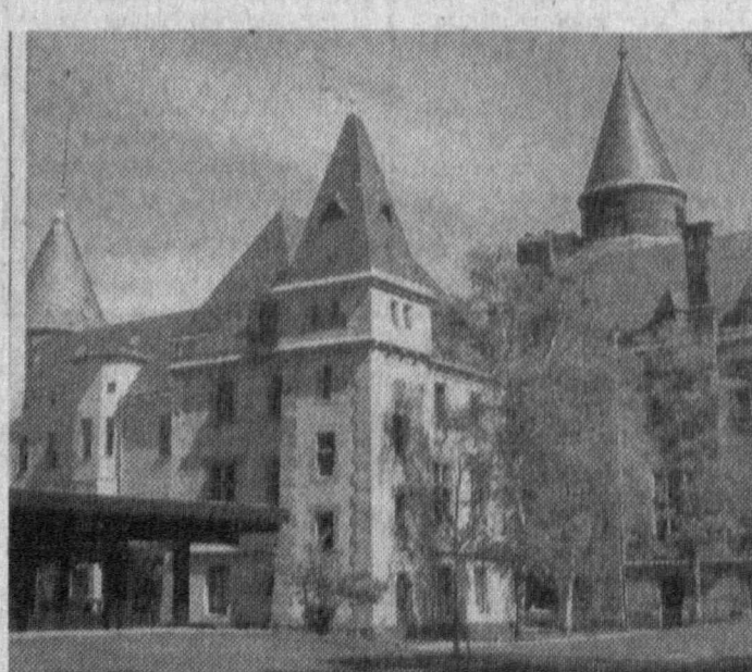
СУРАТДА: Бонндаги обидалардан бири.

Борди-ю, музокаралар ижобий якунланса, Россия дастлаб Кубада битта реакторли АЭС қуради. Мутахассисларнинг ҳисоб-китобига қўра, АЭС 8 йилда сарф этилган харажатни қоплайди. Маълумки, бугунги кунда жаҳон бозорини биргина атом реакторининг нархи 1 миллиард 200 миллион АҚШ долларини ташкил этади.