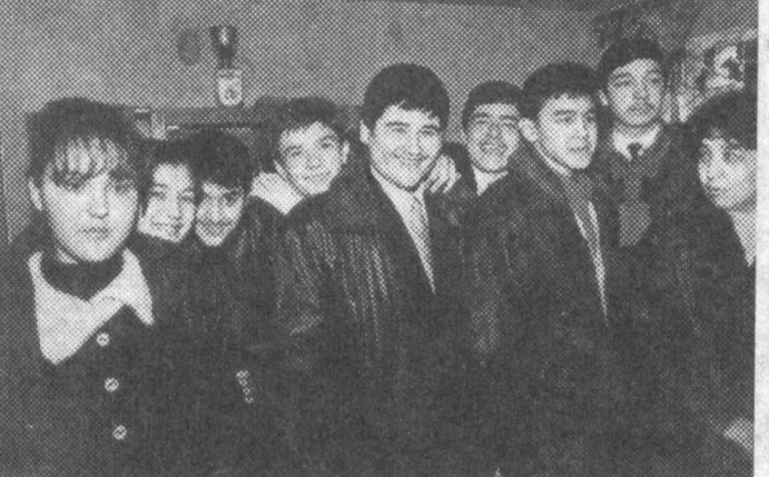
Тошкент шаҳридаги мактабларнинг юқори синф ўқувчилари қишки таътил пайти Англиянинг халқроқ тиллар мактаблари — Хэрроу Хауз, Лондон Хаудда ўқиб қайтишди. СУРАТДА: бир гуруҳ ўқувчилар.