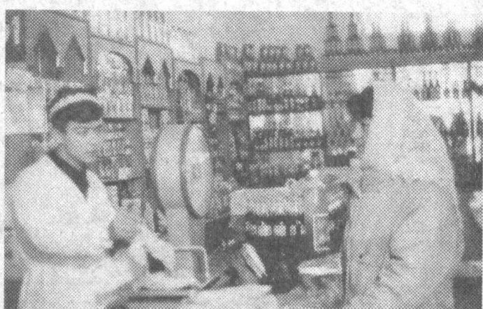
Фирма аъзолари кучи билан бунёд этилган «Туркистон» дўконига аҳоли эҳтиёжга учун зарур бўлган барча нарса топилди. Дўконга 3 та автомобиль ажратилган бўлиб, республикамизнинг турли жойларидан зарур товарлар ўз вақтида келтириб турилади.