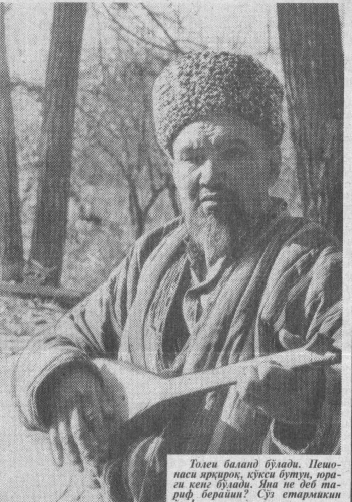
Толем билан бўлади. Пенсия арқаси, кўзи бутун, яраги кенг бўлади. Яна не деб тариф берайин? Сўз етармикан узи!

Шу десангиз, бу Саймон бахшини эшитган чикарсиз-ю. Сурхон воҳасининг Қазирғидан, Ули мактаб кўрмасиз. Бор-йўли уч синф ўқиган. Лекин қонда бор-да, дўмбира чашиб, дөстоналар айтишини ҳеч ким ўргатмас-да, зур бахши бўлиб кетди. Ушунгиз ҳам чашиб, ҳам тўқиб, ҳам айтиб қўлагингизни эритиб юборайди.