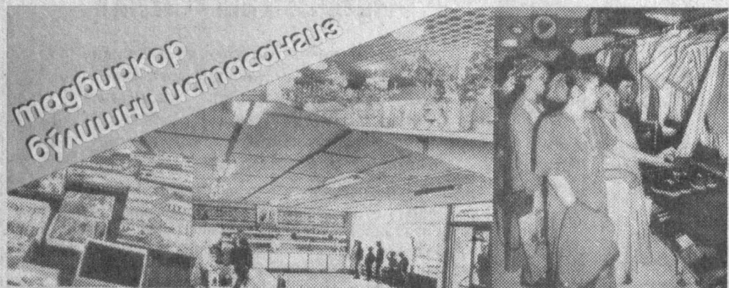
ЁН ДАФТАРИНГИЗ УЧУН