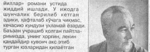
билан сирлашди. Еш эса кетпти, умр ўтпти. Бўлар-бўлмага қўйиб, умрни ўтказиб юбормаслик керак — деб Шўҳрат янги — «Жаннат кидирганлар» романини бошлади. У Ёзувчилар уюмасида назариде четда, жим-жит яшайди. Лекин бир нафас бўлсин, ижод қилиш-

Тиниқ, ижодий йиллар бошланди. Шoir Шўҳрат каламакш дўстлари билан адабиётимиз ривожига яхши-яхши асарлари билан хисса қўша бошладди. Урушда курган-кечирганларидан баҳе омувчи «Шинелли»