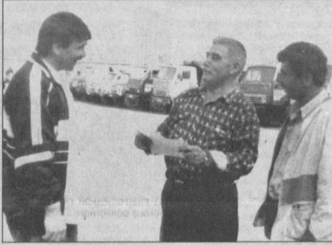
стараемся вовремя их ремонтировать, поэтому они у нас всегда на ходу. Когда автомобиль "бегаёт", и заработки у водителя стабильные. Средняя зарплата уверенно растёт вверх, на первое апреля она достигла 10 тысяч сумов.