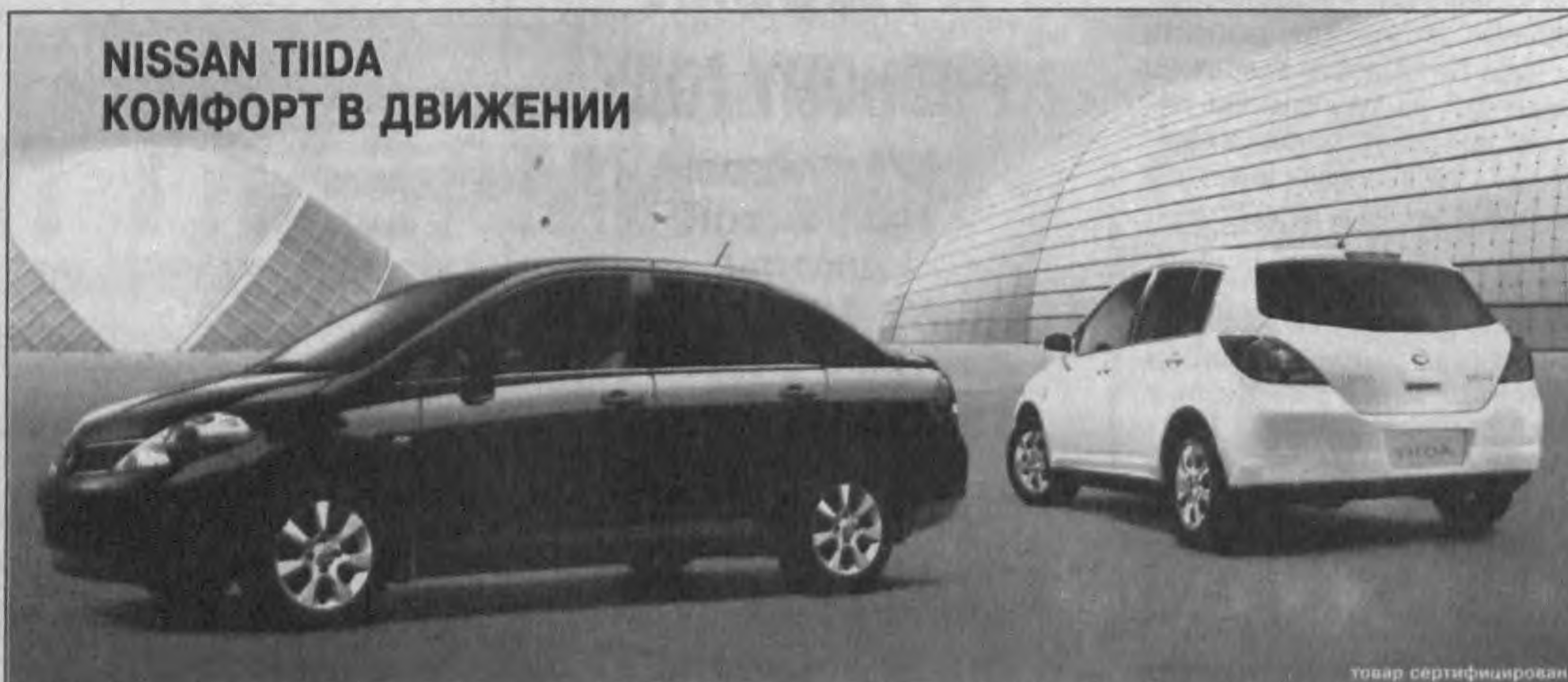
NISSAN TIIDA КОМФОРТ В ДВИЖЕНИИ