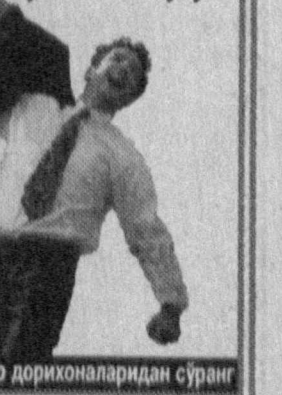
Шаҳар дорихоналаридан сўраг