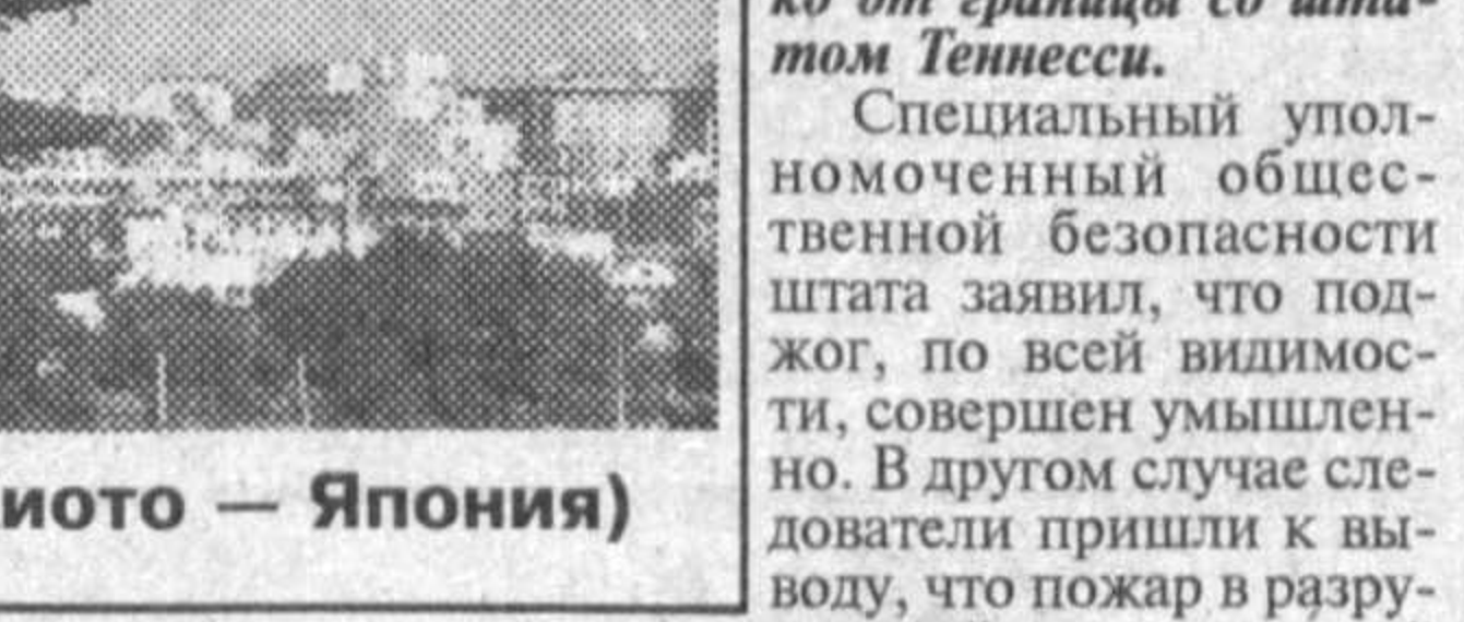
Вид на пагоду (Киото — Япония)