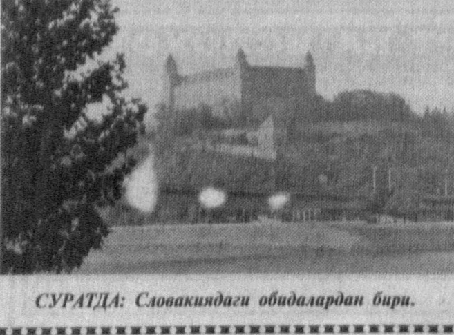
СУРАТДА: Словакиядаги обидалардан бири.

Того давлати пойтахти -- Ломеда Африка қитъасидаги 15 давлат раҳбарларининг фавқулодда учрашуви бошланди.