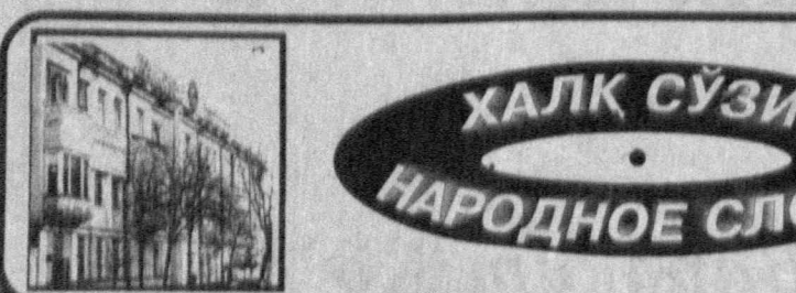
Рўйхатдан ўтиш тартиби № 0001 Буюртма Г. — 0227

Биз назарда тутган замонда тил ва ёзув қандай шаклланиб эди? Аввало ёзув деганда нима тушуномқ керак? Энг қадим инсонлар ўз фикрларини турли шартли расмлар билан ифодалаганлар. Бундай қўйиш суратлари жуда қадимги даврлардан маълум қилинган.