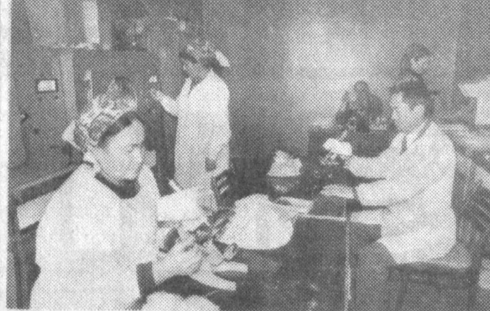
Ўзбекистон пахтачилик илмий-тадқиқот институтининг Сурхондарё бўлими селекционерлари ишчиқа талаби пахтанинг «Термез — 31» навиини яратган эдилар. Утсан йили вилоят деҳқонлари ундаи мула ҳосил олдлар. Йқинда улар яратган «Термез — 32» навиини ҳам муваффақият билан баҳолашди.

Узун туманида олти ярим минг нафардан зиёд озуначи бор. Шуларнинг 226 нафари «Халқ сўзи»га обуна бўлишган.