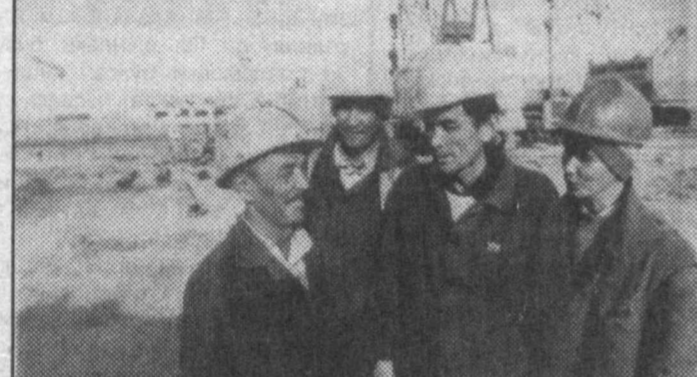
Тахминан 328 метр узунликда кўприк қуриши қарор қилинди. У битса, Қорақалпоғистон пойтахтини Хужайли шаҳри билан боғлайди. С.РАҲИМОВ кўришди.

Халқ демократик партияси фракциясининг йиғилиши ХДП Марказий Кенгашининг мажлислар залида бўлиб ўтади. Ҳокимият вакиллик органларидан сайланган депутатлар блоки ҳамда «Адолат» социал-демократик партиясининг фракцияси Олий Мажлисида йиғилади. «Ватан тарққиёти» партияси фракциясининг йиғилиши шу партия Марказий Кенгашининг мажлислар залида ўтказилади. Депутатлар партия фракцияларининг ҳамда блокларнинг йиғилишлари 23 апрель кuni соат 11.00 да ўтказилади.