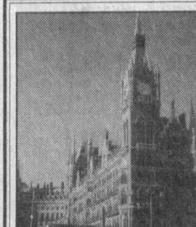
Музейнинг кўриш панорамаси

«Уйга қайтиш йўқ» деган машҳур романини у шу ерда ёзган.