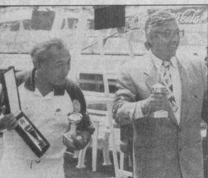
Ўтган йили биринчи «Хавас» турнири май ойи-нинг муҳим воқеаси

роҳиб аниқланди. Албатта, турнирни ўтказишдан мақсад роҳибни аниқлаш эмас, балки одамларга теннис, спорт шуқуни ҳақиқатан эитишдир. Турнирга Генрих Дашевский бошчилигидаги «Динамо» клуби аъзолари ҳакамлик қилишди.