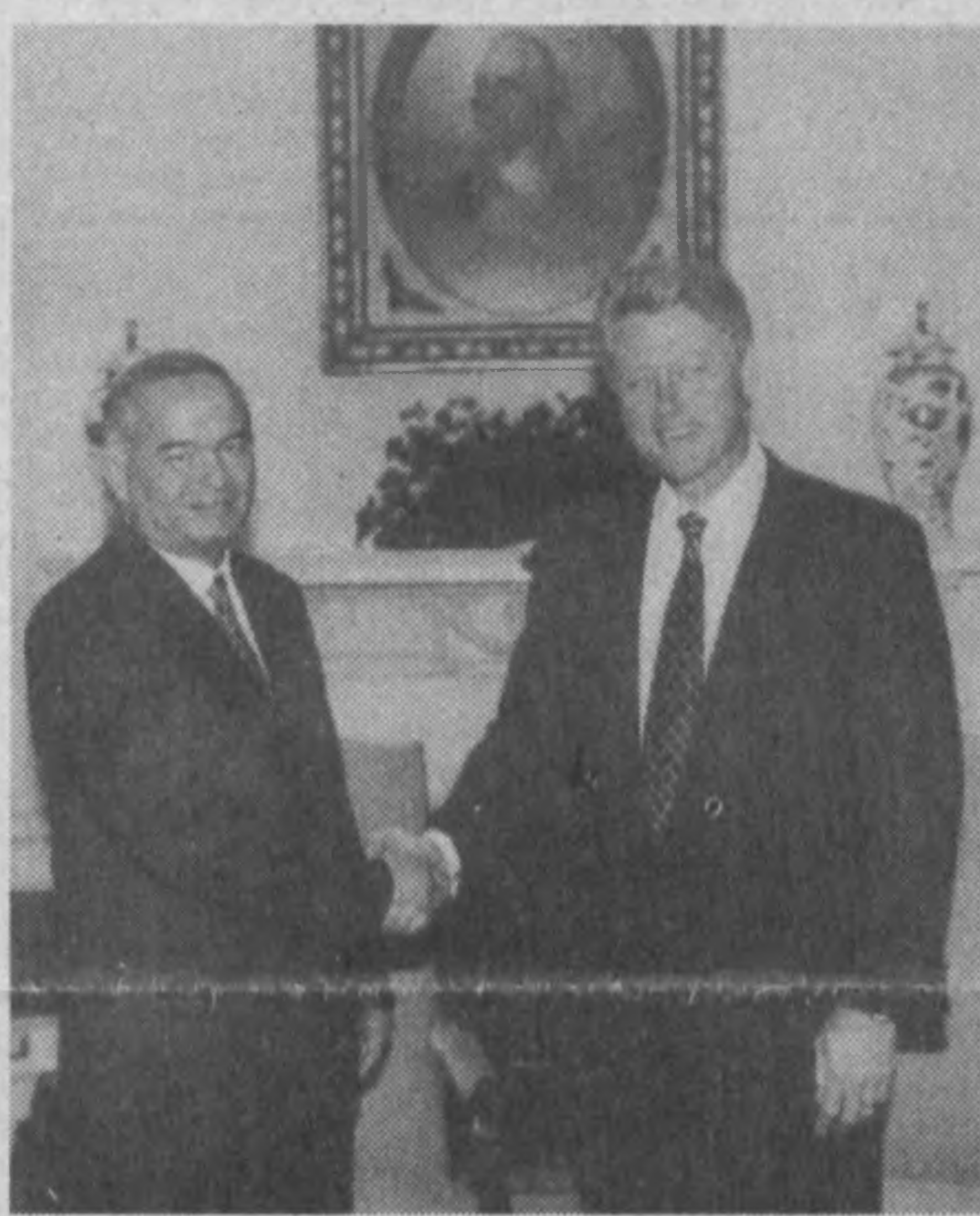
Во время встречи Президента Узбекистана Ислама Каримова с Президентом США Биллом Клинтонем.

В ходе встречи Билл Клинтон подтвердил, что США всемерно заинтересованы в укреплении независимости, стабильности и развитии стран Центральной Азии. Еще одна примечательная сторона встречи состоит в том, что руководство США, признавая ведущую роль Узбекистана в обеспечении мира и стабильности в Централь-