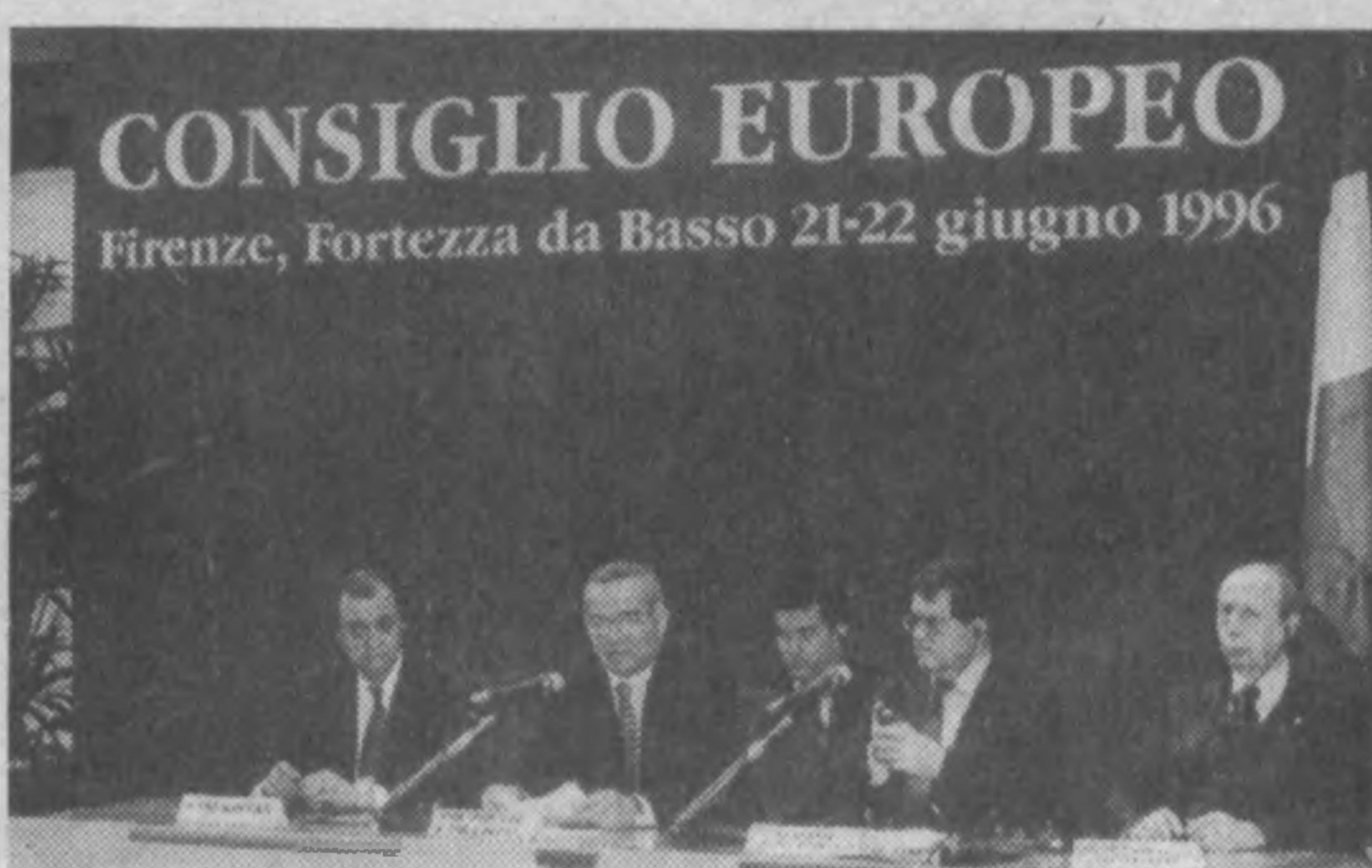
Выступление Президента Республики Узбекистан И. Каримова на церемонии подписания Соглашения о партнерстве и сотрудничестве между Республикой Узбекистан и Европейским союзом.

Уважаемый господин Председатель! Уважаемые главы государств и правительства! Дамы и господа! Прежде всего позвольте выразить признательность за высокую честь быть приглашенным на встречу глав государств и правительств стран — членов Европейского союза во Флоренции. Подписание Соглашения о партнерстве и сотрудничестве между Узбекистаном и Европейским союзом — это, безусловно, важное событие, знаменующее новый, поворотный этап наших отношений.