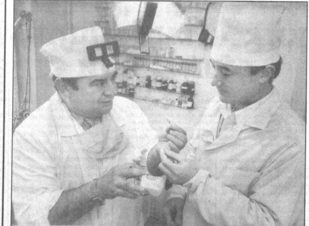
Имплатация нима у? Урнатилган тиш қопламаларининг худди асл ҳолидагидек намоён бўлишидир. Қўқон шаҳрида республика имплатология-стоматология маркази ташкил этилган. Ушбу маскан Хитой, Болгария, Германия, Италия билан ҳамкорликда иш олиб