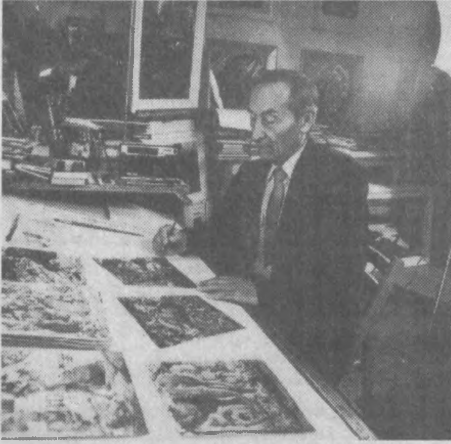
«Амир Темура — полководец», «В бою», «Амир Темура и юный Улутбек». Отрадно, что эти произведения, а также 12 листов цветных автолитографий «Юность Навои», «Жизнь и деятельность поэта Навои» (темпера), портреты масло А. Навои и его современников выдвинуты на соискание премии им. А. Навои — главной республиканской награды за достижения в области литературы и искусства.