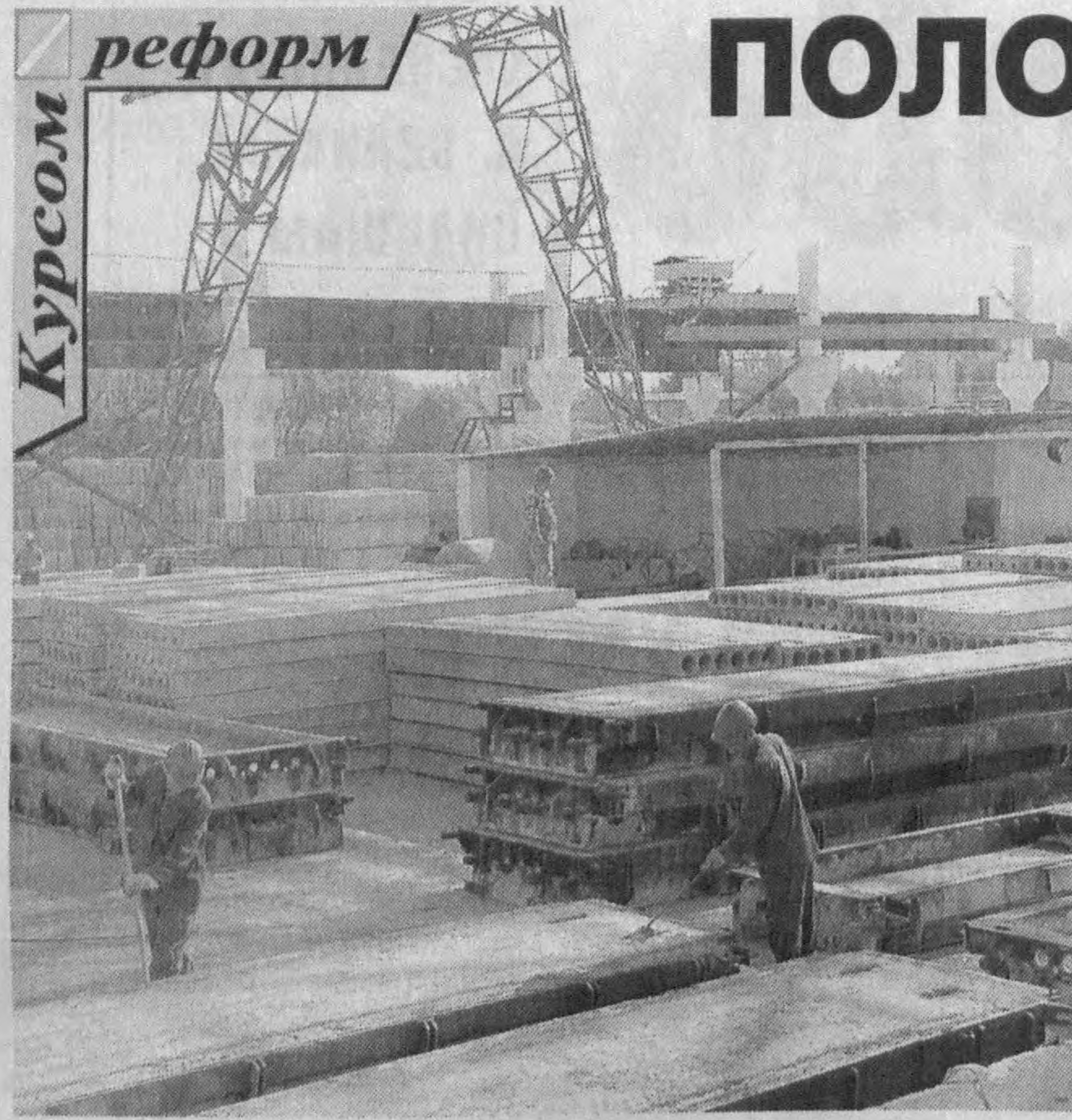
(Окончание. Начало на 1-й стр.)

Исходя из вышесказанного, в АК «Узстройматериалы» разработана и реализуется концепция развития цементной промыш-