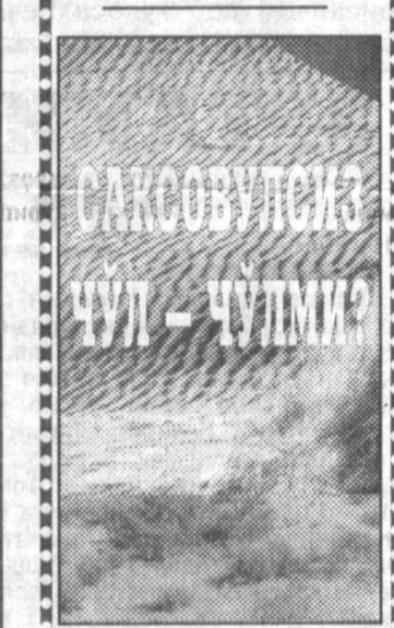
1997 йил кўклами ҳам тарихга айланиб бормоқда. Бу фаслда қўллаб юмушлар амалга оширилмоқда. Айтилик, шу даврда ўтказилган дов-дараклар ўнлаб, юзлаб, минглаб йил туриши мумкин...