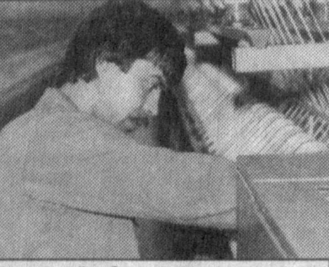
дошимни «қўзаб», мунозарага чорламоқчи бўлиди. -- Узингиздан қолар гап йўқ, сарф-ҳаражатларни камайтириш учун бўлса керак, баъзи корхона ва ташкилотларда штат қисқартириш, ходимларни ишдан бўлатиш ҳоллари учраб туради...