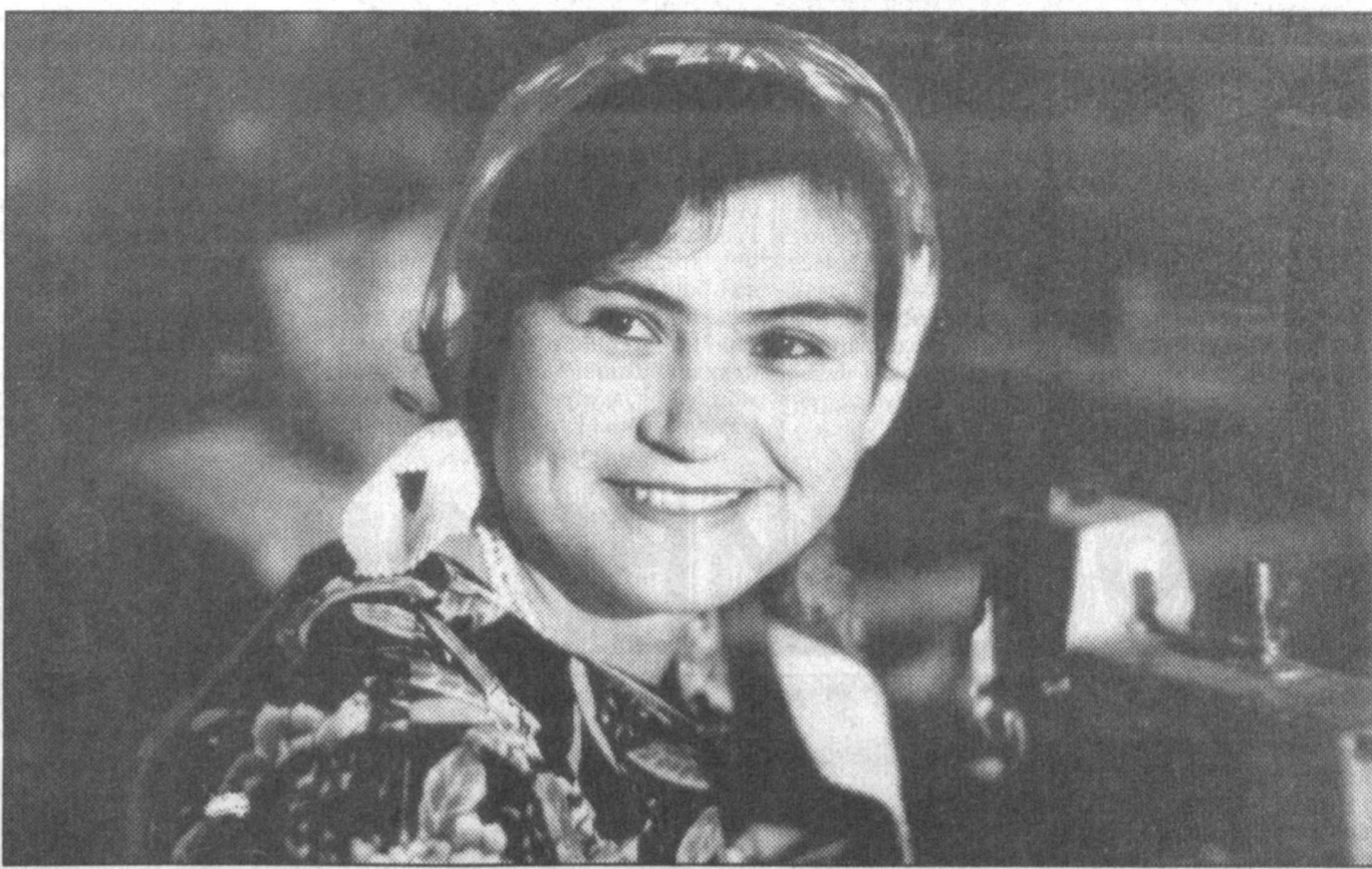
Учқўприк тикув-трикотаж ҳиссадорлик жамияти вилоятдаги...