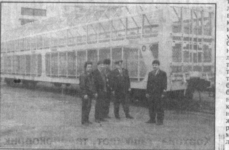
Тошкент теллово-созлаш заводида ишлаб чиқариш жараёни.