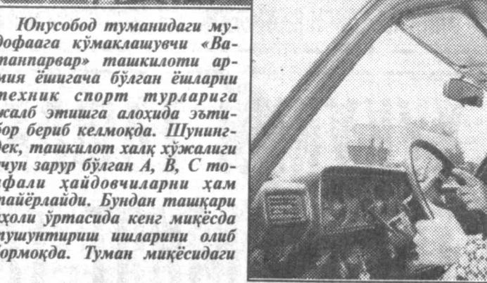
Юнусобод туманидаги мудофаага қўмаклашувчи «Ватанпарвар» ташкилоти армия ёшгача бўлган ёшларни техник спорт турларига жалб этишга алоҳида эътибор бериб келмоқда.

Юнусобод туманидаги мудофаага қўмаклашувчи «Ватанпарвар» ташкилоти армия ёшгача бўлган ёшларни техник спорт турларига жалб этишга алоҳида эътибор бериб келмоқда. Шунингдек, ташкилот халқ хўжаюни учун зарур бўлган А. В. С. тоифали ҳайдовчиларни ҳам тайёрлайди. Бундан ташқари аҳоли ўртасида кенг миқёсда тушуштириш ишларини олиб бормоқда. Туман миқёсидаги