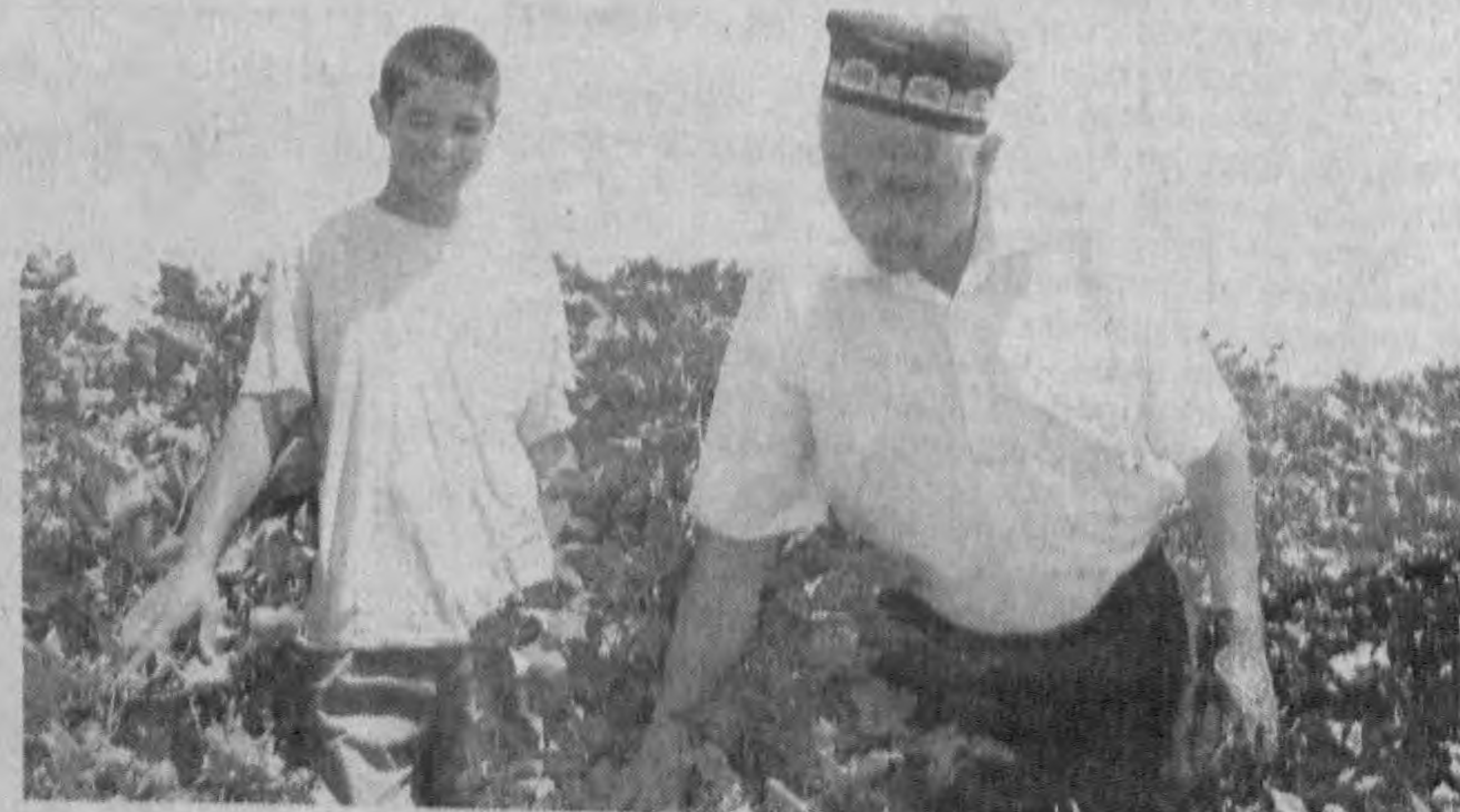
Материалы полосы подготовила Гулбахор ТАНИРОВА, наш соб. корр.

Плодородные, уже сформировавшиеся на кустах хлопчатника, свидетельствуют об отменном урожае «белого золота». Сосчитав на одном из таких кустов до двадцати хлопковых колосочков, фермер довольно улыбается. — Судя по всему, договорные обязательства по хлопку мы и в этом году перевыполним, — вслух рассуждает он. А на мою просьбу поделиться секретом хорошего урожая, бесхитриво отвечает: — Все просто: надо любить землю, лелеять, насыщать минеральными и органическими удобрениями, защищать ее, своевременно, с применением техники, проводить все агрохозяйственные мероприятия, а главное, ценить и уважать людей, работающих на ней.