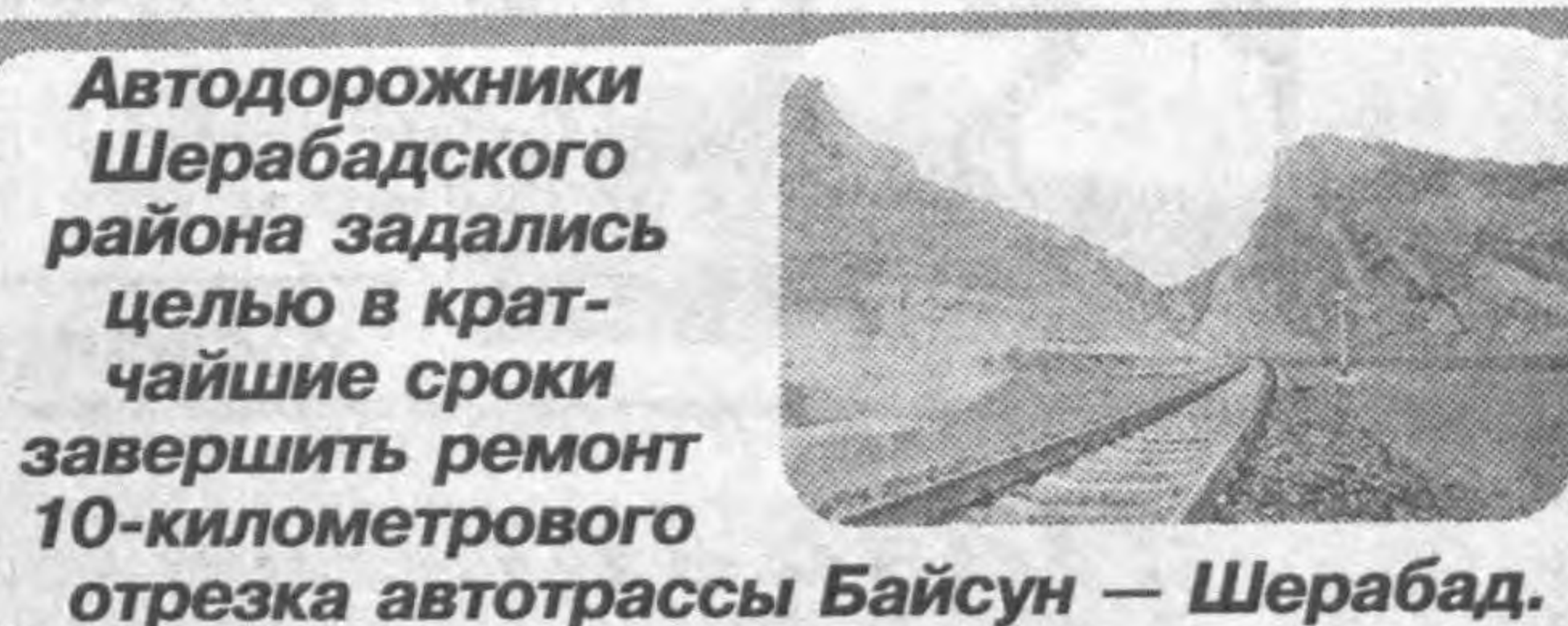
Автодорожники Шерабадского района задалились целью в кратчайшие сроки завершить ремонт 10-километровой отрезка автодороги Байсун — Шерабад.

В результате осуществления этих и других работ будет достигнуто еще один важный параметр. Так, по прогнозам специалистов, за 2008 — 2012 годы по Сурхандарьинской области будет создано около 200 тысяч новых рабочих мест. Словом, выполнение данной программы позволит нам не только выйти из дотационного обеспечения, но и способствовать укреплению экономики как Сурхандарьинской области, так и республики в целом, поможет насытить рынок страны новыми отечественными товарами хорошего качества, трудоустроить тысячи людей и, конечно же, повысить жизненный уровень населения.