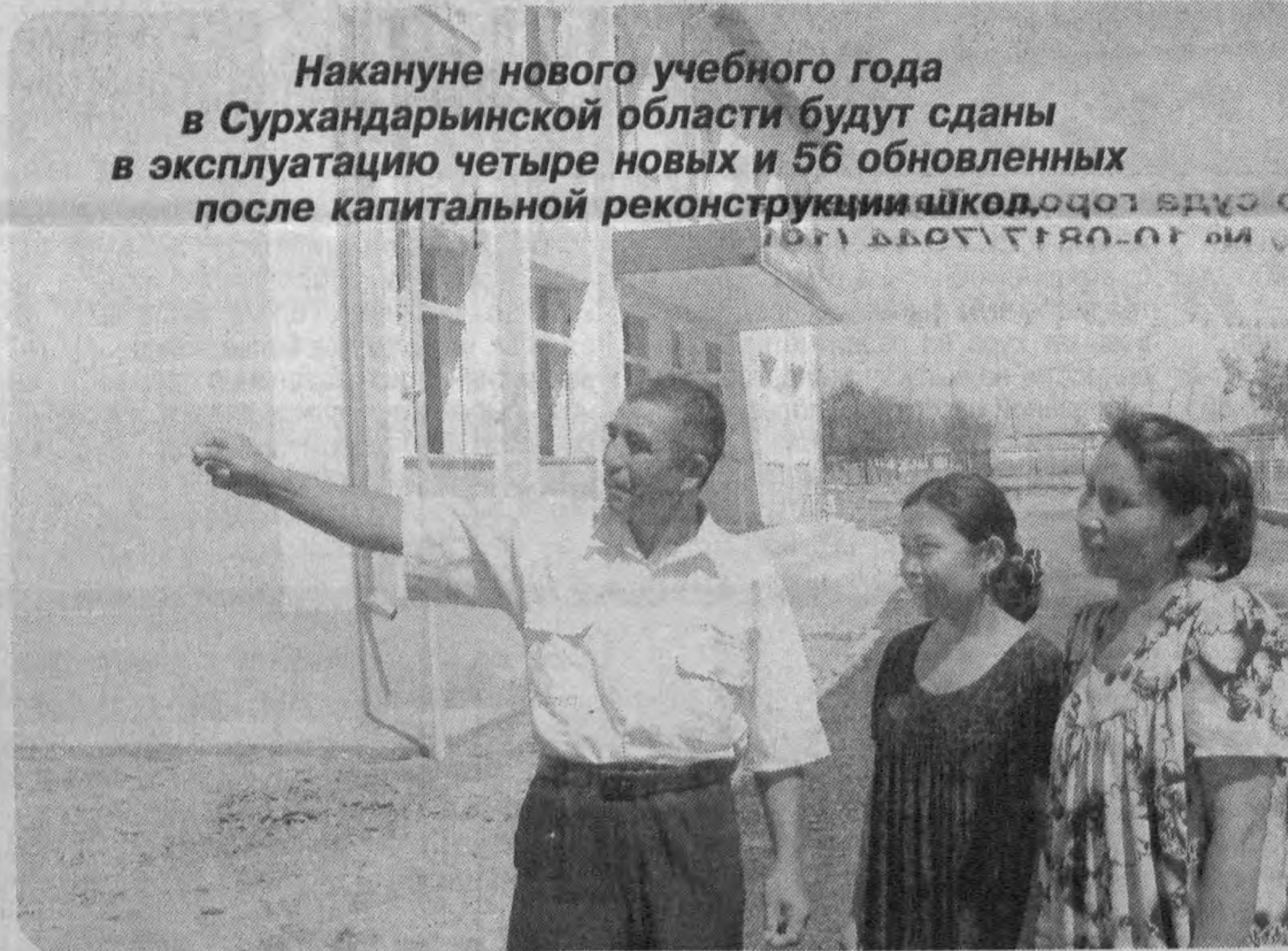
Накануне нового учебного года в Сурхандарьинской области будут сданы в эксплуатацию четыре новых и 56 обновленных после капитальной реконструкции школ. В новом учебном году сельских ребятишек ждут его просторные и светлые классы. Сейчас здесь идет комплектация мебели, учебным, лабораторным и компьютерным оборудованием, необходимым инвентарем оснащается спортивный зал.

На сегодняшний день в двадцати из них завершены ремонтно-строительные работы, и сейчас идет установка нового оборудования в лингафонных кабинетах, мастерских, лабораториях. В каждой из школ в обязательном порядке предусмотрено открытие компьютерных классов. Одна из новых школ на 160 мест построена в Ангорском районе. Ранее ученикам 40-й школы приходилось учиться в тесных классных комнатах приспособленного здания полувекковой давности. Учебный процесс был организован в несколько смен, условия не соответствовали нормам современного обучения. В текущем году в рамках Государственной общенациональной программы развития школьного образования для детей труженников махалли «Озод