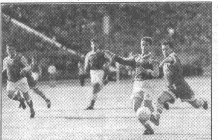
13-турнинг яна бир кичик воқеаси Термизда содир бўлди. «Сурхон» ниҳоят мавсумдаги ўзининг биринчи галабасига эришти. Гарчи «Зарафшон» баҳсларнинг, айниқса, қизиқарили утажақлигидан далолат беради.

Чемпионат жадалига жамоалар совинлар учун кураш олиб борадиганлар ва олий лигадаги маквени сақлаб қолиш учун баҳслашадиганлар гуруҳларида ажралишти. 6-ўринни эгаллаб турган «Сўғдиёна» ва 17-ўринда бораётган «Зарафшон» жамоалари жамгарган очколарида бор-йўли 10 очко фарқ борлиги олий лигада маквени сақлаб қолиш учун курашувчилар ўртасидаги