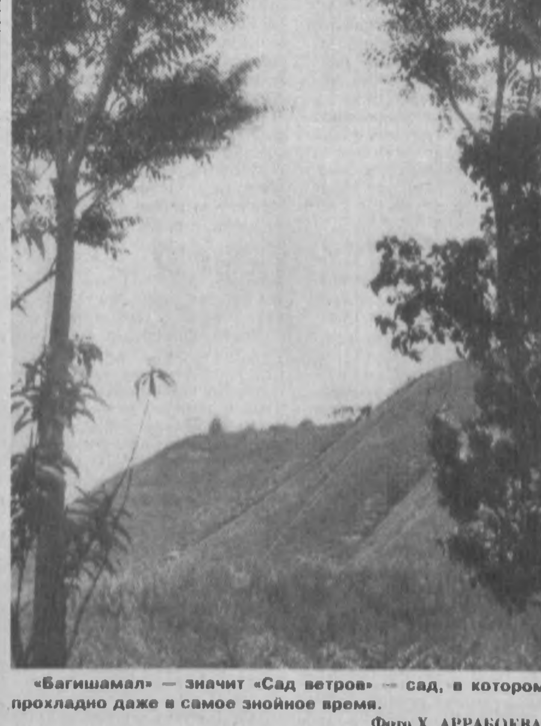
«Багшишамал» — значит «Сад ветров» — сад, в котором прохладно даже в самое знойное время.

«Бизнес-имкон» — так называется основным в Андижанской области организация, призванная помочь начинающим и уже состоявшимся предпринимателям осуществить задуманное дело. Организация «Бизнес-имкон» по инициативе и при непосредственном участии областного управления Комитета по экономическим реформам и развитию предпринимательства и Андижанского института экономики и инженерии.