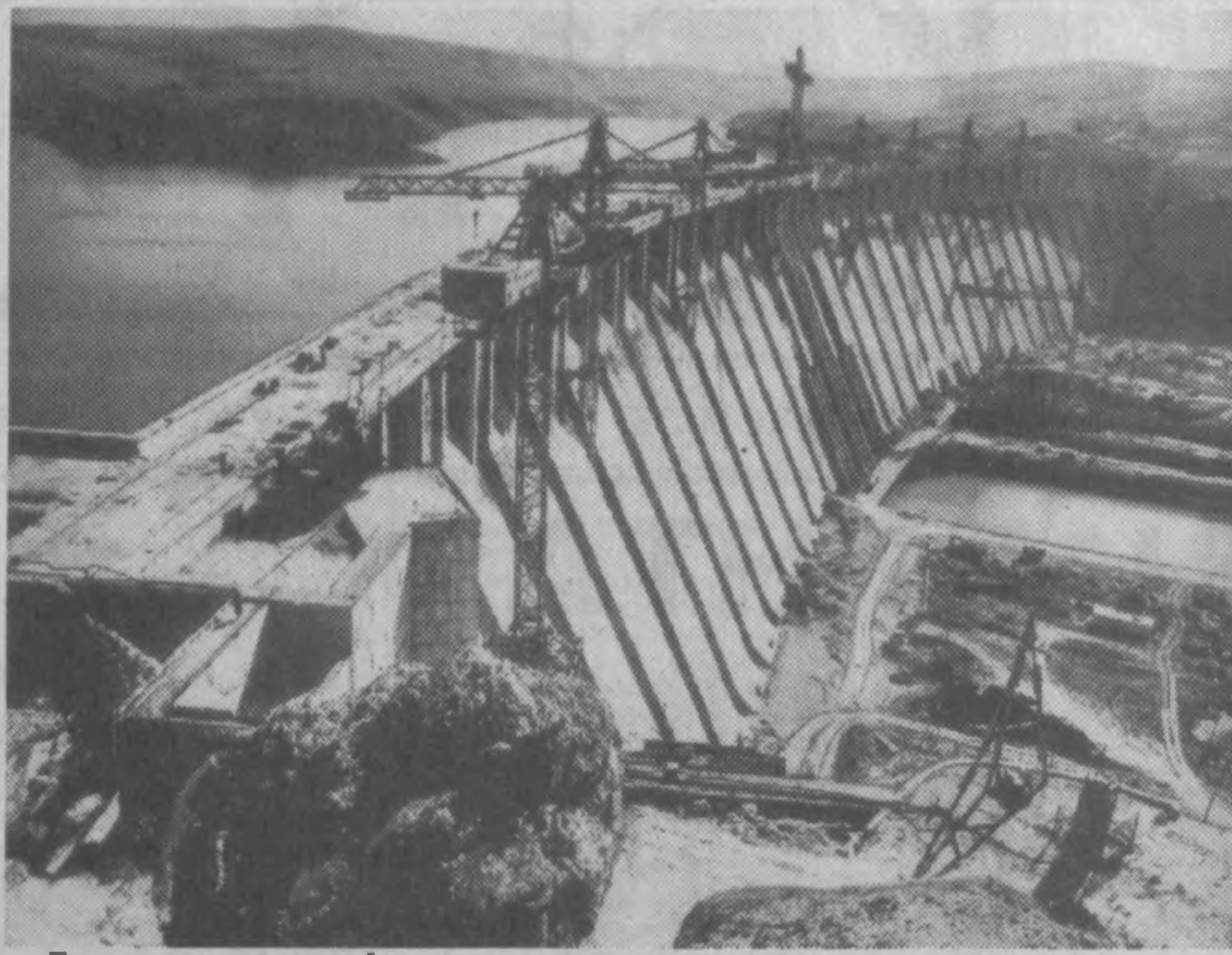
Большая плотина Андижанского водохранилища.

Сохраняя прежние объемы производства хлопка-сырца, сельские труженики в несколько раз увеличили производство других сельскохозяйственных культур. О росте производства говорят такие цифры: по сравнению с 1994 годом производство мяса увеличилось на 21,4 процента, молока — на 2,7 процента. За последние 2—3 года увеличились объемы строительных работ. В Андижане построен теннисный корт, стадион «Наврзу», разбит национальный парк имени Бабура в Багшишамале. Строятся совместные предприятия по производству запчастей для Асакинского автозавода. За годы независимости сдано в эксплуатацию 2,51 миллиона квадратных метров жилья, школ на 25,87 тысячи учеников, детских садов на 4,295 мест, больниц на 1,087 коек. В области 897 дошкольных детских учреждений, 723 общеобразовательных школы, из которых 9 — специальные школы-интернаты, 2 дома милосердия, 25 лицеев, 21 гимназия. В гимназиях и лицеях обучаются 7,400 учащихся. Большое внимание уделяется в области развитию сети культурно-просветительных учреждений. Сейчас действуют 645 библиотек, 28 музыкальных школ, 219 клубов и домов культуры. Андижанцы уверенно смотрят в будущее. И эта уверенность придаст им новые силы.