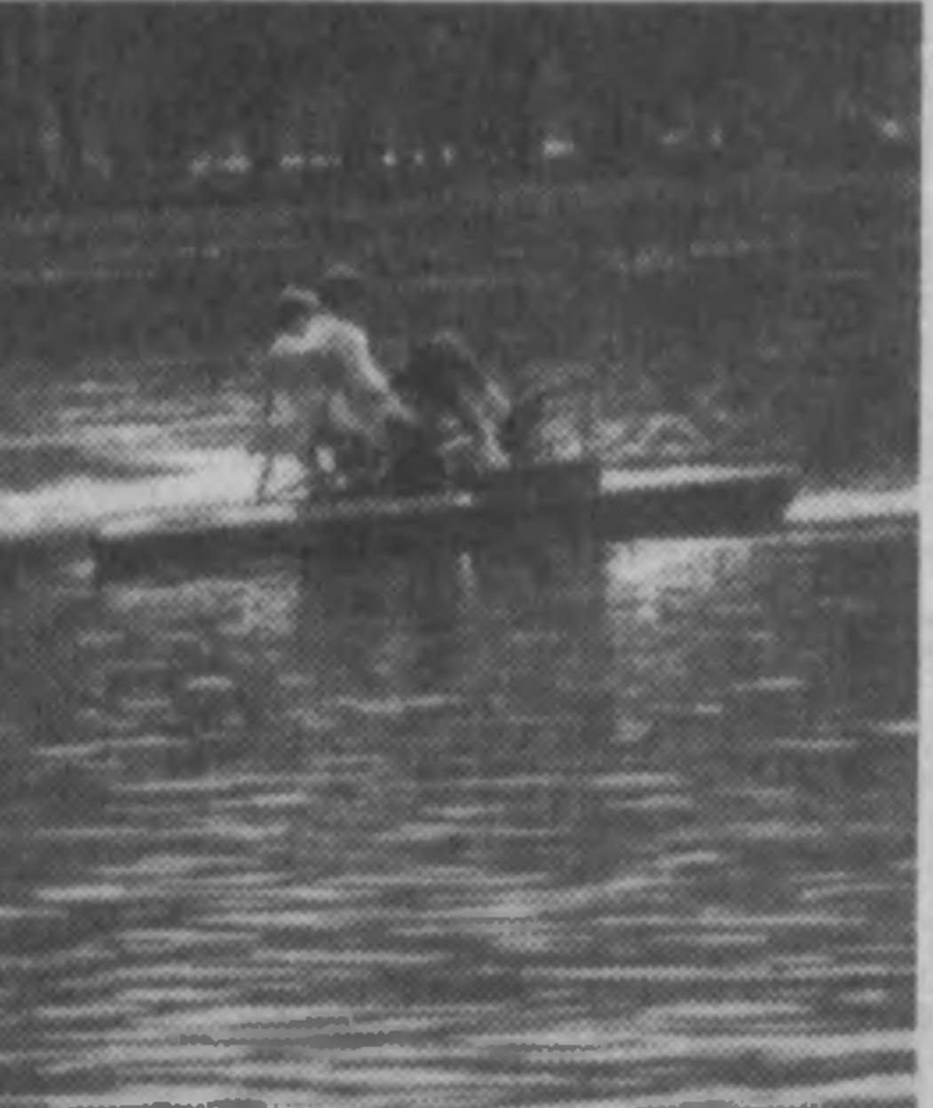
Узбекистан и мир