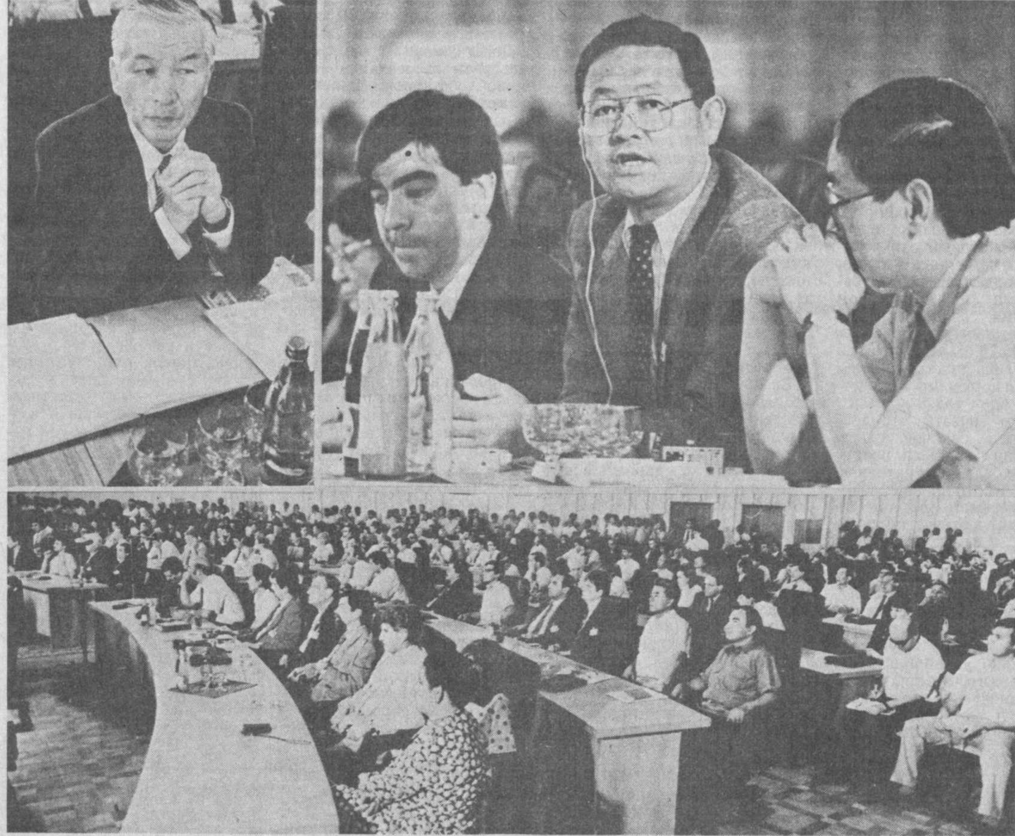
НА СНИМКАХ: во время встречи.

Символ «Ташкентской деловой встречи» — две сцепленные в дружеском пожатии руки. Декларация о суверенитете Узбекской ССР, коренные изменения, происшедшие в политической и экономической областях, открыли широкие перспективы для самостоятельного выхода республики на международный рынок. Это подтвердила и недавно прошедшая сессия Верховного Совета