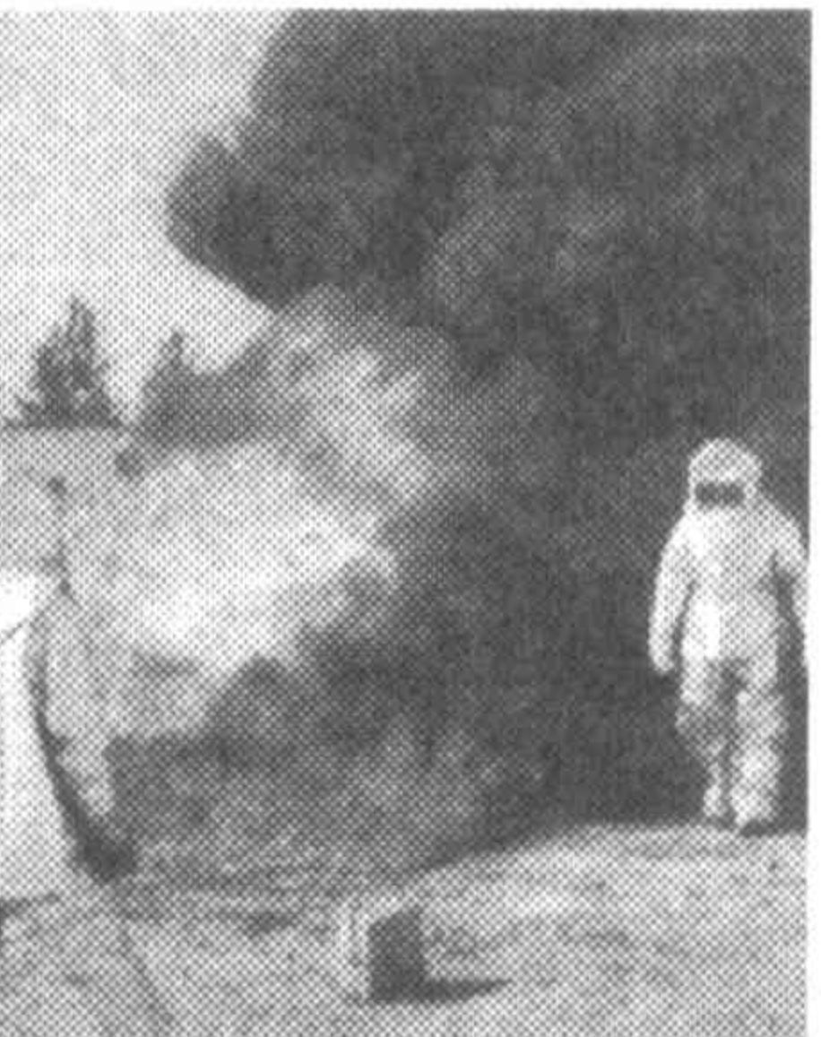
Техники Управления пожарной охраны города. — Высота автолестницы «Магирус» — 50 метров...

пожарной безопасности должен стать нелихим напоминанием: будьте бдительны!