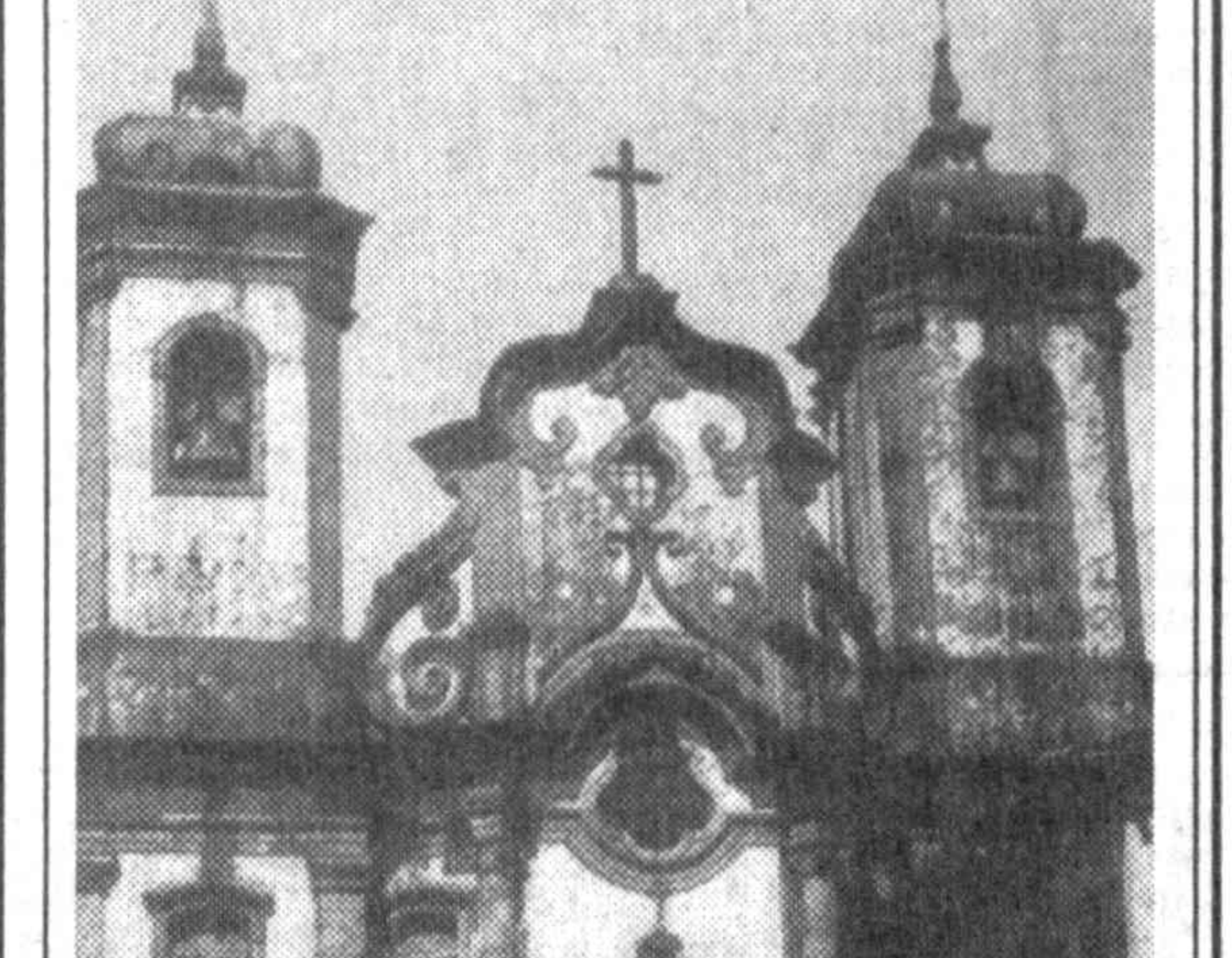
Церковь в Ору-Прету (Бразилия).