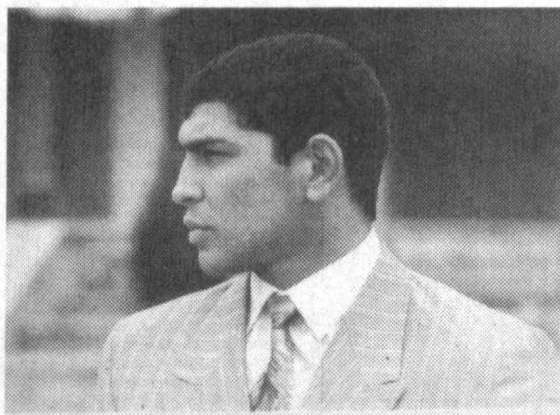
57 кг уступил немцу Хусту — 4:8, а Тимур в категории до 81 кг...