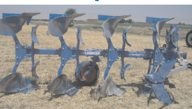
Плуг (ЕврОпал 73+1)