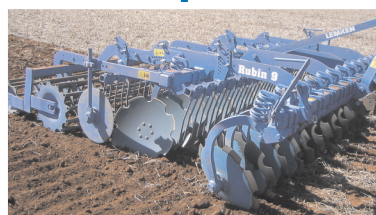
Дисковая борона (Рубин 9/300)