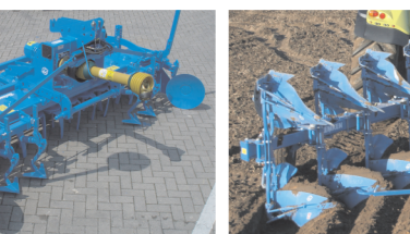
Ротационная борона (Циркон 8/250)