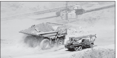
На разрезе «Ангрентский» начал работать мощный роторный комплекс, который позволил, в частности, нарастить добычу угля.

В настоящее время, учитывая значимость увеличения доли угля в энергетическом балансе республики, перед отраслью поставлены важные задачи, первоочередными из которых является увеличение после первого этапа перевооружения разреза «Ангрентский» к 2016 году ежегодного производства вскрышных работ на 25,1 миллиона кубометров в год с доведением его объемов до 42,6 миллиона кубометров, а также увеличение добычи, транспортировки, погрузки угля с 3,2 миллиона тонн до 6,4 миллиона тонн в год.