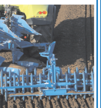
Почвоуплотнитель (Вариоплак 110)

Всем видам техники оказываются сервисные услуги