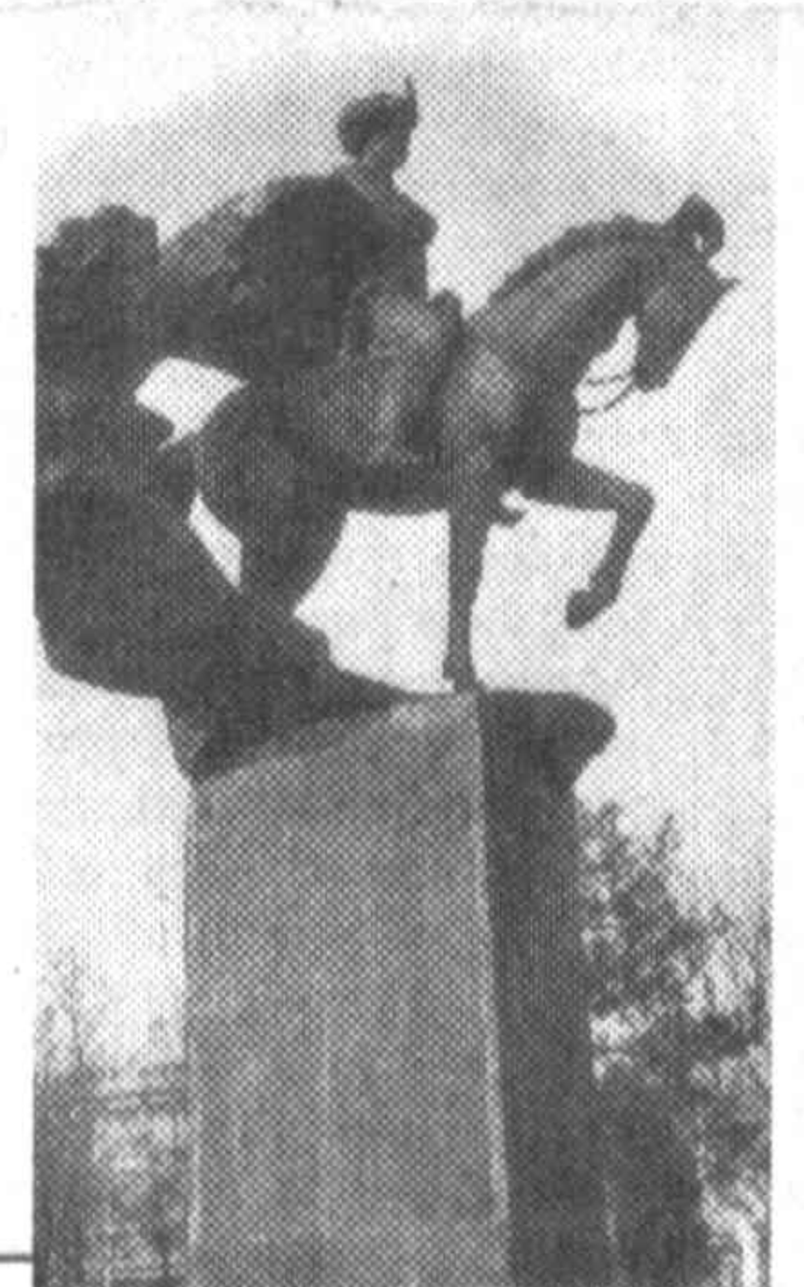
Свободной и счастливой мечтал видеть наш предок Бабур Мирзо свою землю. Такие времена настали.