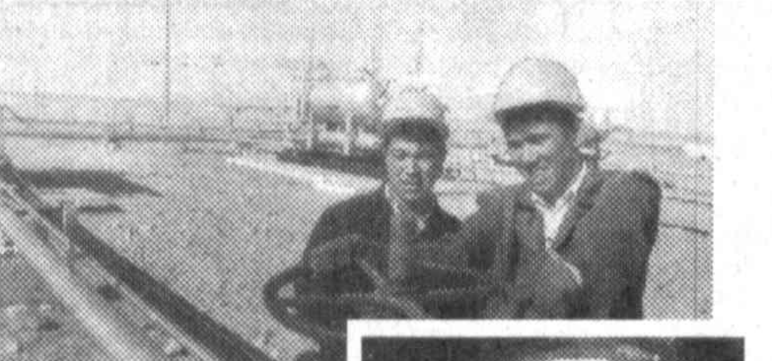
Ургинское месторождение газа обеспечило голубым топливом сотни домов жителей Каракалпакстана.