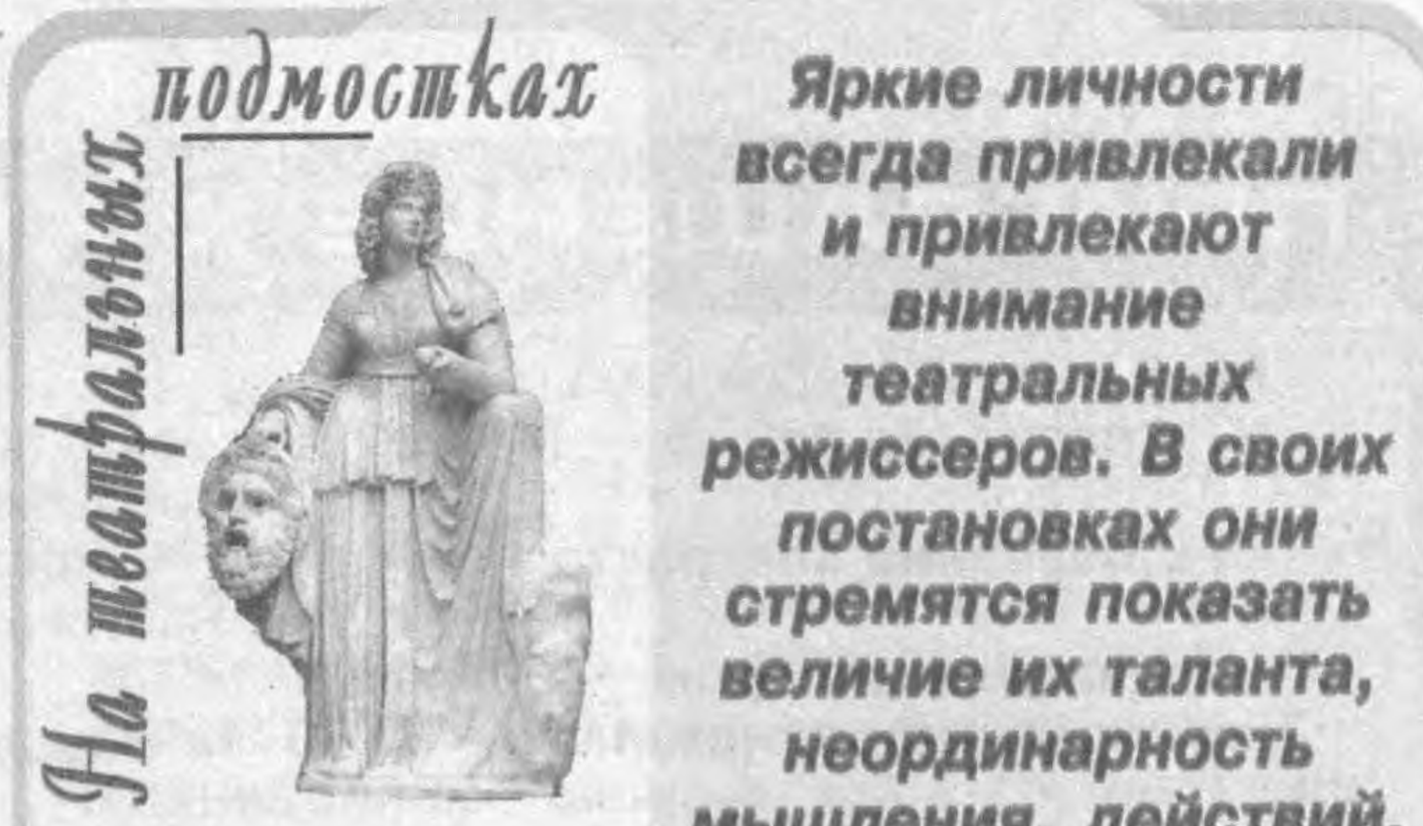
Яркие личности всегда привлекали и привлекают внимание театральных режиссеров. В своих постановках они стремятся показать величие их таланта, неординарность мышления, действий.