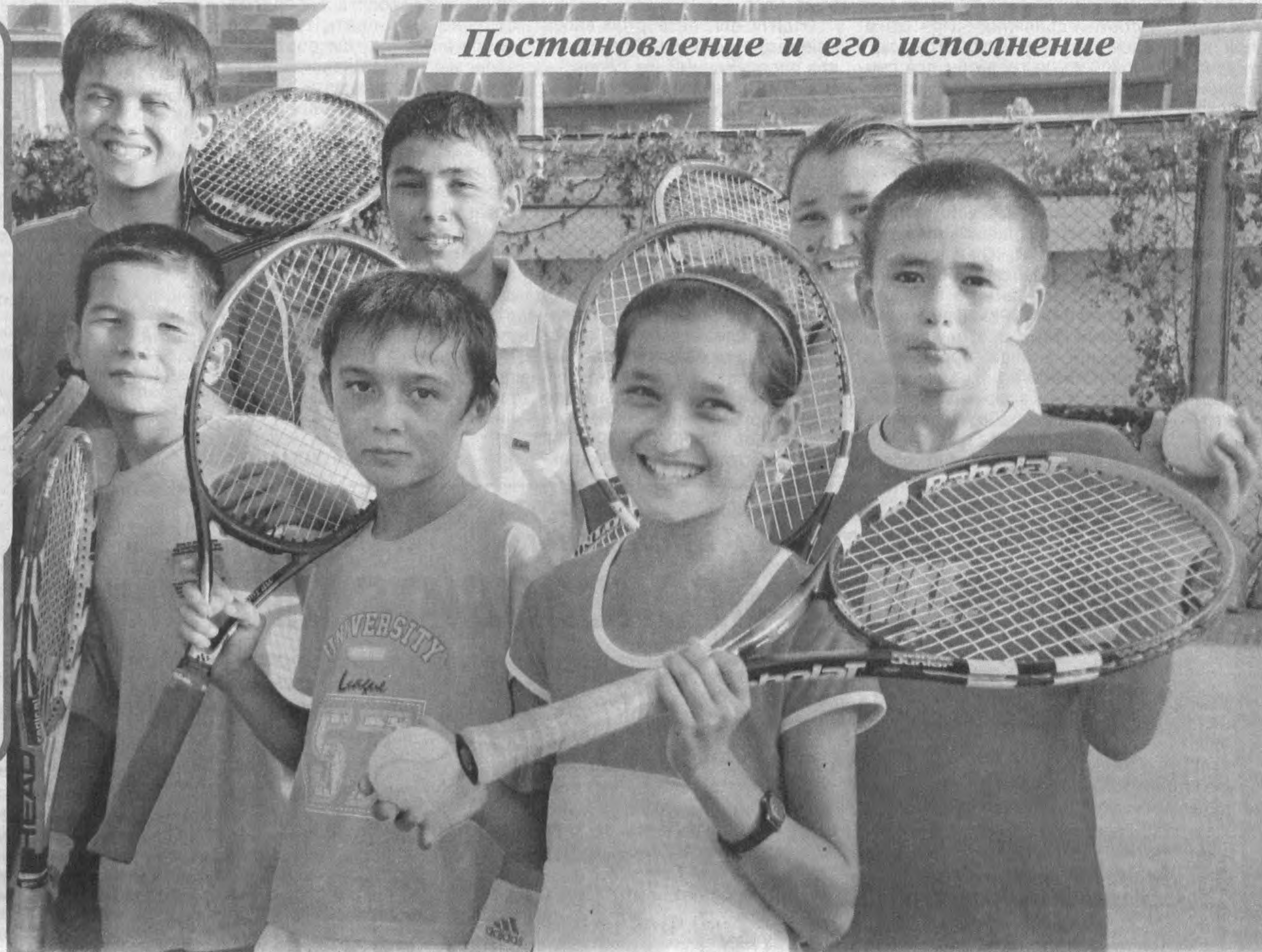
Постановление и его исполнение

Сложно даже предположить, что всего за четыре месяца, прошедшие со дня выхода в свет Постановления Президента Узбекистана «О создании Республиканской теннисной школы олимпийского резерва», будет проделана столь грандиозная работа. Но это — уже свершившийся факт! Сегодня РТШОР является единственной в Центральной Азии. Первые юные теннисисты приступили к учебно-тренировочному процессу в этом уникальном учреждении.