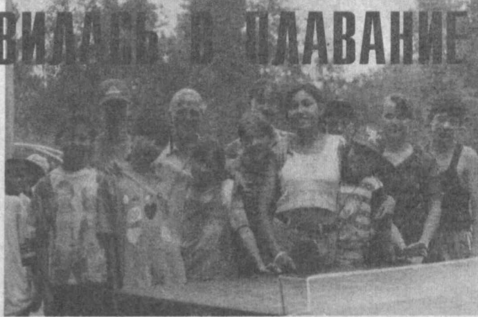
НА СНИМКАХ: вот так интересно проводят летние каникулы ребята, отдыхающие в детском оздоровительном лагере «Бригантина».

Кроме того, юным «курортникам» предлагаются интересные походы, всевозможные развлечения и игры.