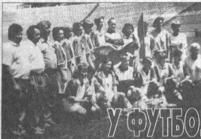
Хоким области поздравил участников чемпионата и вручил ценные подарки командам-призерам.