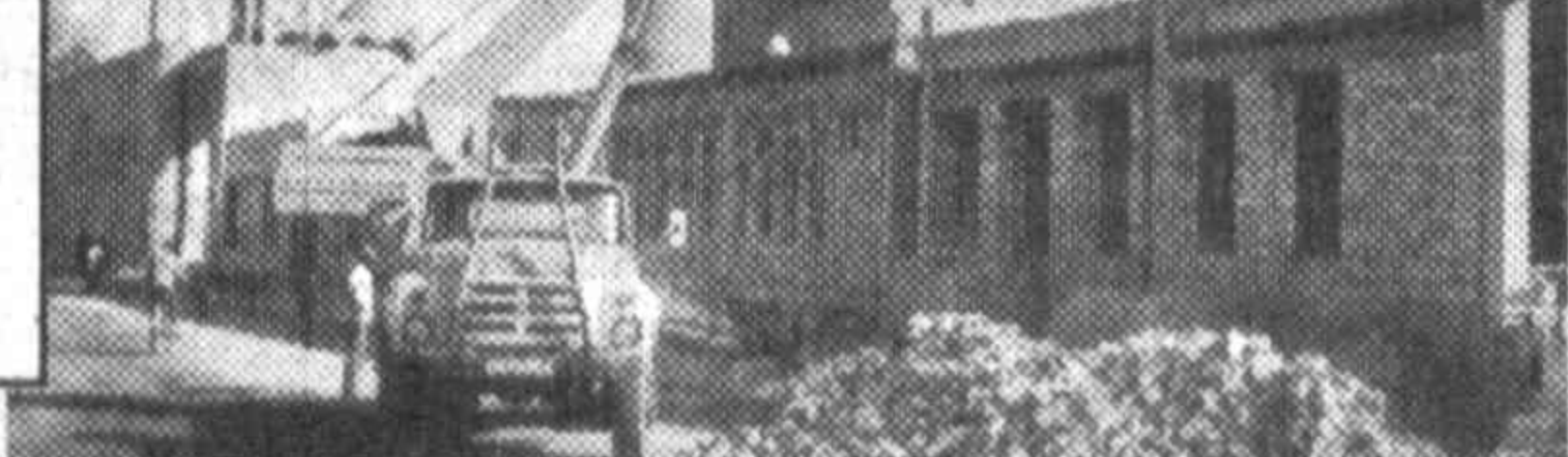
В преддверии праздника независимости хорошеет древняя Бухара.