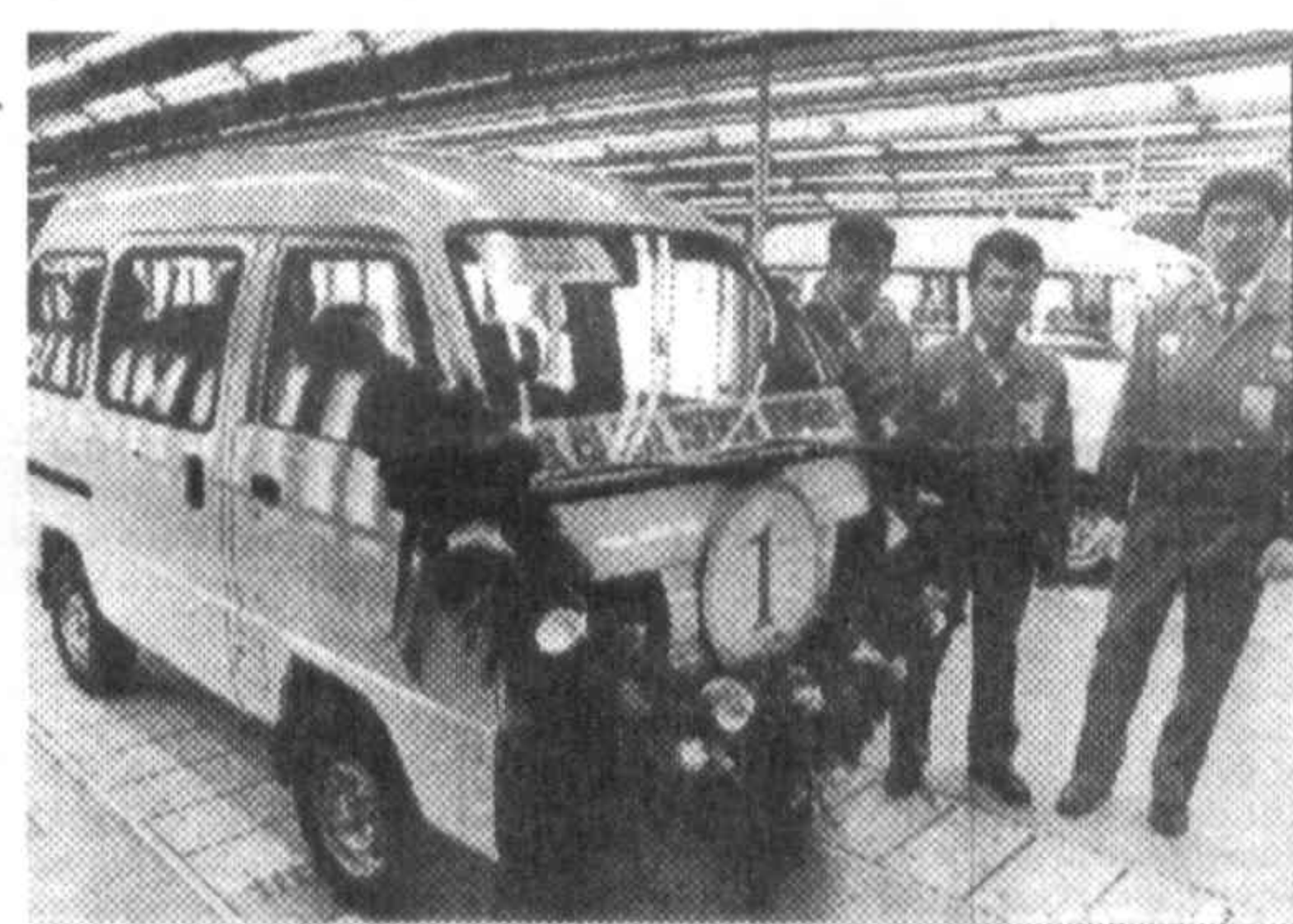
Так выглядит первый автомобиль, сошедший с конвейера узбекско-южнокорейского СП «УзДЭУавто». В добрый путь!